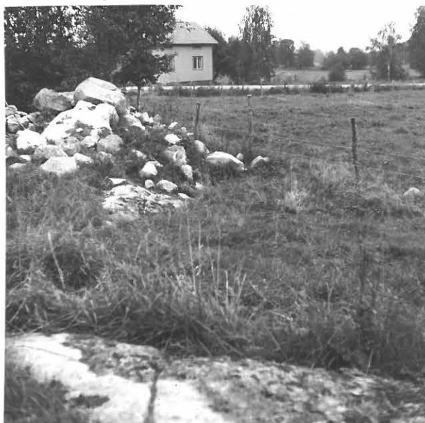
5. UHRIKALLIO 6 ETUALALLA. TAUSTALLA HEIKKOSEN TALO