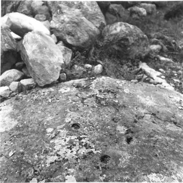
1. UHRIKALLION 2 KUOPAT