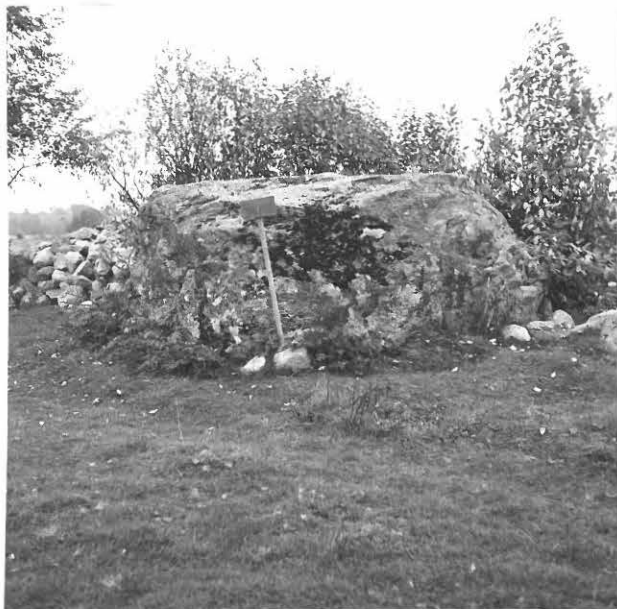
4. UHRIKIVI 5 RAUHOITUSKILPINEEN