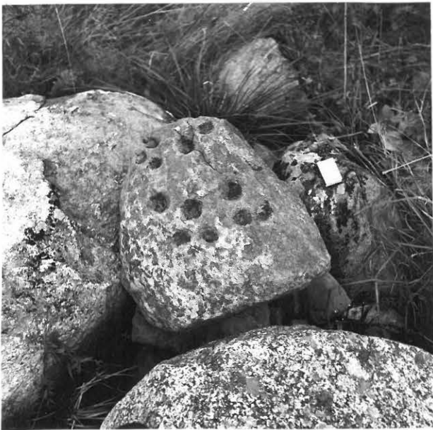
2. UHRIKIVI 3 LÖYTÖPAIKKANSA VIERELLÄ. OIKEASSA YLÄKULMASSA NÄKYVÄ MURTUMAA.