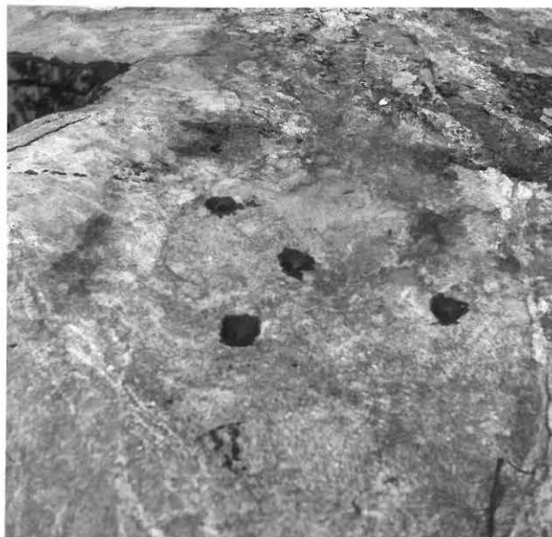
6. UHRIKALLIO ? HEIKKOSEN MAALLA. KUOPAT KASTEITU