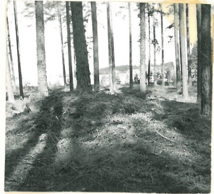
Maansekainen kivikum- pu. Päällä karvaa mänty.