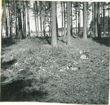
Etsialalla maansekainen kivikumpu.