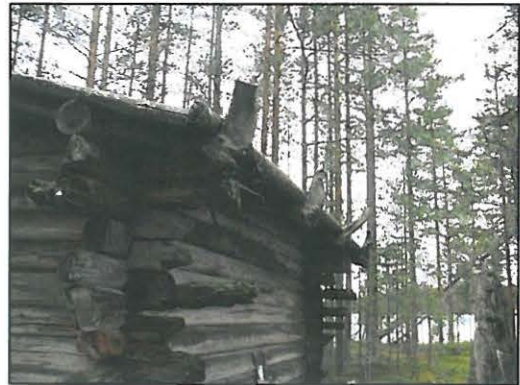
Nurkka- ja kattodetalji