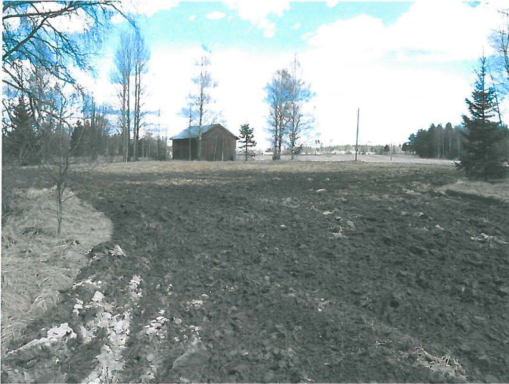
Kuva 5. Lamminrannan tilan pohjoispuolista kynnöspeltoa. Etelästä

Kynnöksen lisäksi tarkastin Lamminrannatien viereen talvella 2009-10 kaivetun jätevesiputken kaivannon. Oja oli kaivettu lähelle Susikaslammi 1 asuinpaikka-alueetta. Mitään erityistä ei kaivuumaiden pinnalla näkynyt (kuva 6). Havaintojen perusteella kunnallistekniikkaa oli kaivettu ympäri Susikkaan kylän aluetta.