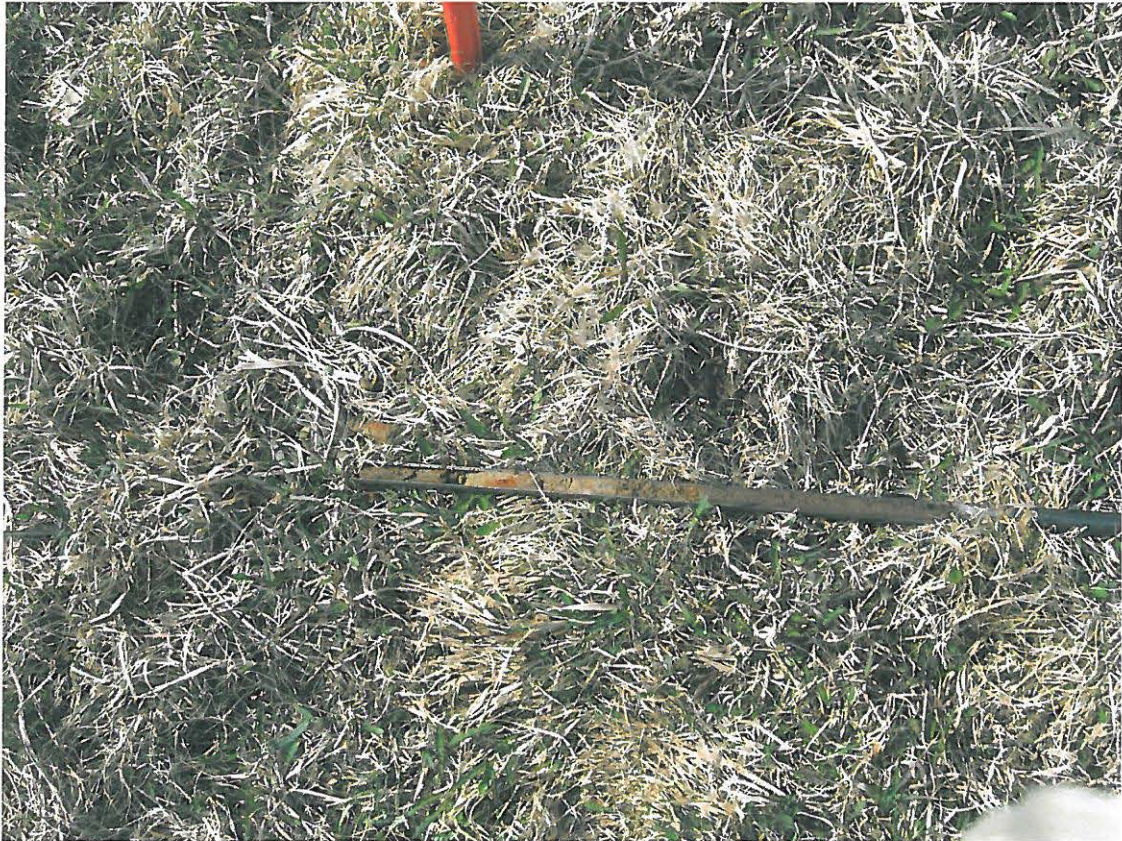
Kuva 2. Kairaus ja punainen hiekkaläikkä.

Tarkastuksen yhteydessä maaperää selvitettiin koekairalla, jolla kairattiin näytteitä mahdolliselta sähkömaakaapelin kaivantoalueelta, sekä tuulivoimaloiden paikoilta. Havaintojen perusteella maaperä on alueella yhtenäisesti hienoa hiesuhiekkamaata jonka pinnassa on väriltään tumma 25-30 paksuinen savimultakerros (kyntömaa). (ks. kuva 2 .) Yhdessä kairauksessa vaaleassa hiesussa oli punainen hiekkaläikkä (ei punamultaa), löytöjä ei tullut eikä poikkeamia.