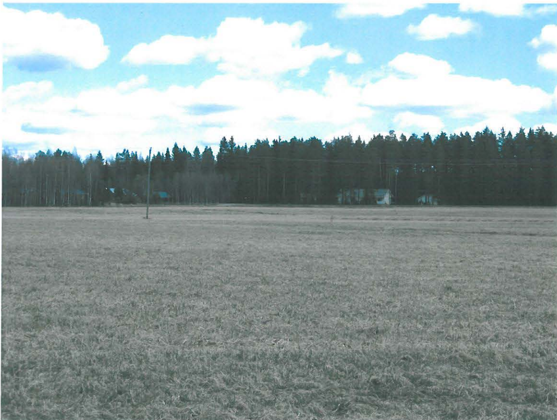
Kuvassa paalut, takana Susikaslammi 1 asuinpaikkatöyräs. Kuva: Olli Soininen, lounaasta

Tarkastuksen ajaksi Kemppinen oli merkinnyt pyynnöstä tuulivoimaloiden suunnitellut paikat merkkipaaluin (ks. kuva 1). Paaluja oli kolme, tuulivoimaloita sen sijaan rakennetaan vain kaksi myöhempien sijaintiselvitysten pohjalta. Tuulivoimalat sijaitsevat Lamminrannan tilakeskuksen kaakkoispuolella avoimella, tasaisella pellolla aivan tilarajan läheisyydessä.