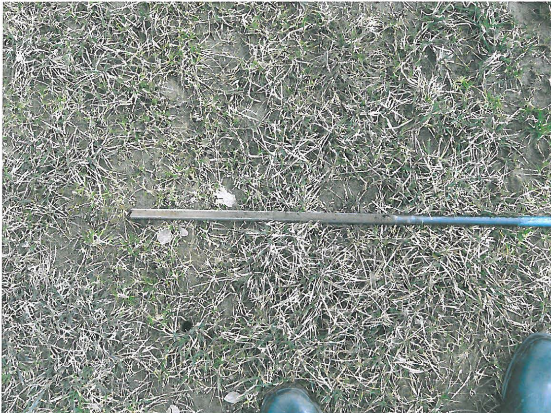
Kuva 3. Salaojakaivon paikka

Suunniteltu salaojituksen keruukaivon paikka sijaitsee päärakennuksen eteläpuolella piha-alueella kohdassa, joka on luontaisesti kostea. Paikalle tehdyissä kairauksissa ei näkynyt erityistä, tumman savisen multamaakerroksen syvyys oli 50 cm. Maa oli selvästi kosteampaa. (Kuva 3. )