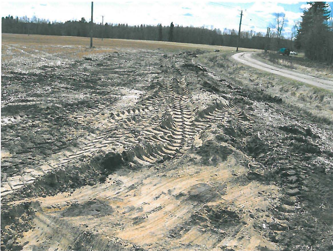
Kuva 6. Jätevesiputken kaivantoa. Oikeassa yläkulmassa Lamminpään tila