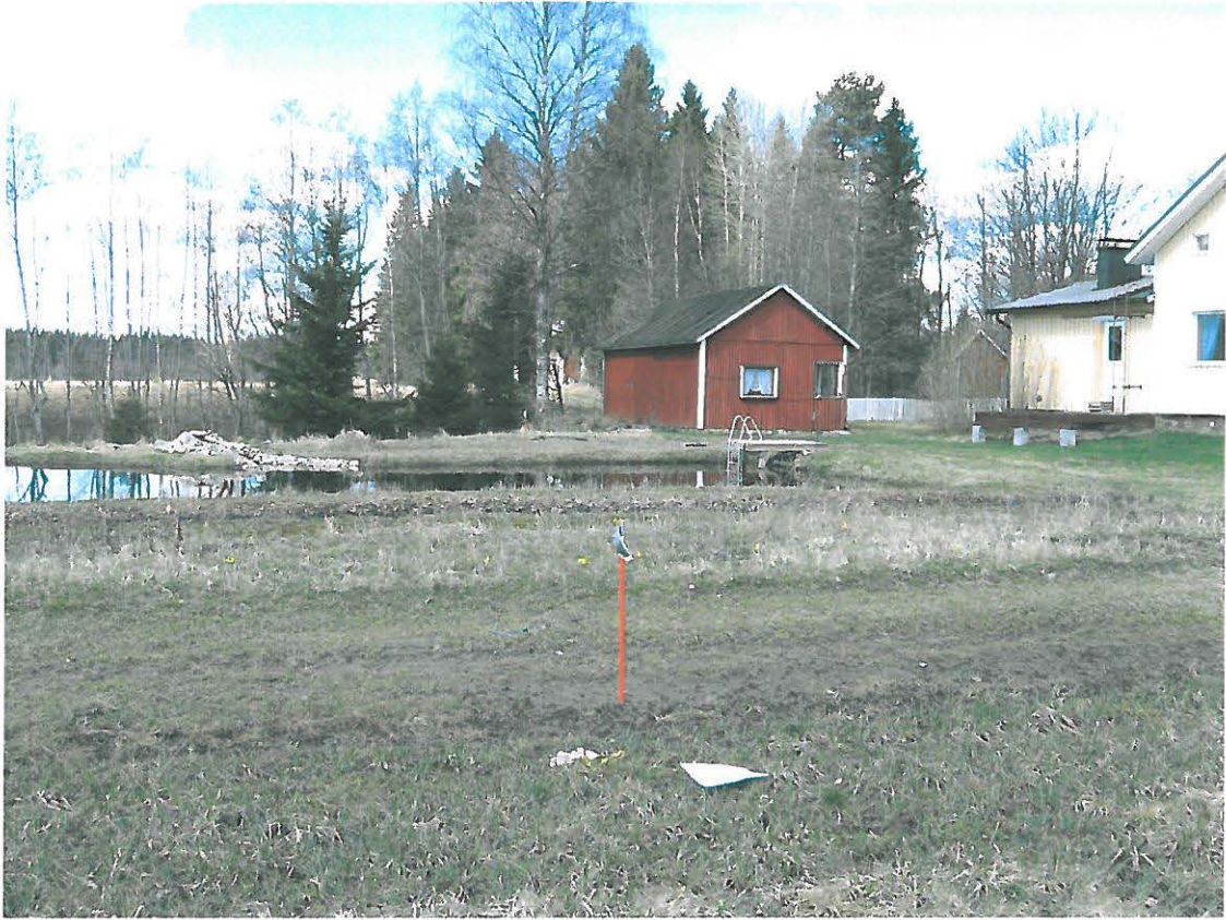
Kuva 4. Suunniteltu salaojien keruukaivon paikka edessä, pihakeittiön paikka takana. Kuvattu idästä.

Lisäksi tarkastuksen yhteydessä pinta poimittiin Lamminrannan tilan pohjoispuolella, pienen joen rannalla sijaitseva kynnetty peltoalue (ks. kuva 5.). Noin 25 cm syvyinen kynnös oli väriltään tummaa hyvin hienoa hiesuhiekkamaata jossa paikka paikoin esiintyi vaaleita ”lämpäreitä”). Kaiken kaikkiaan maa oli hyvin puhdasta, sieltä ei löytynyt muutamaa kahvikupin palasta lukuun ottamatta mitään löytöjä.