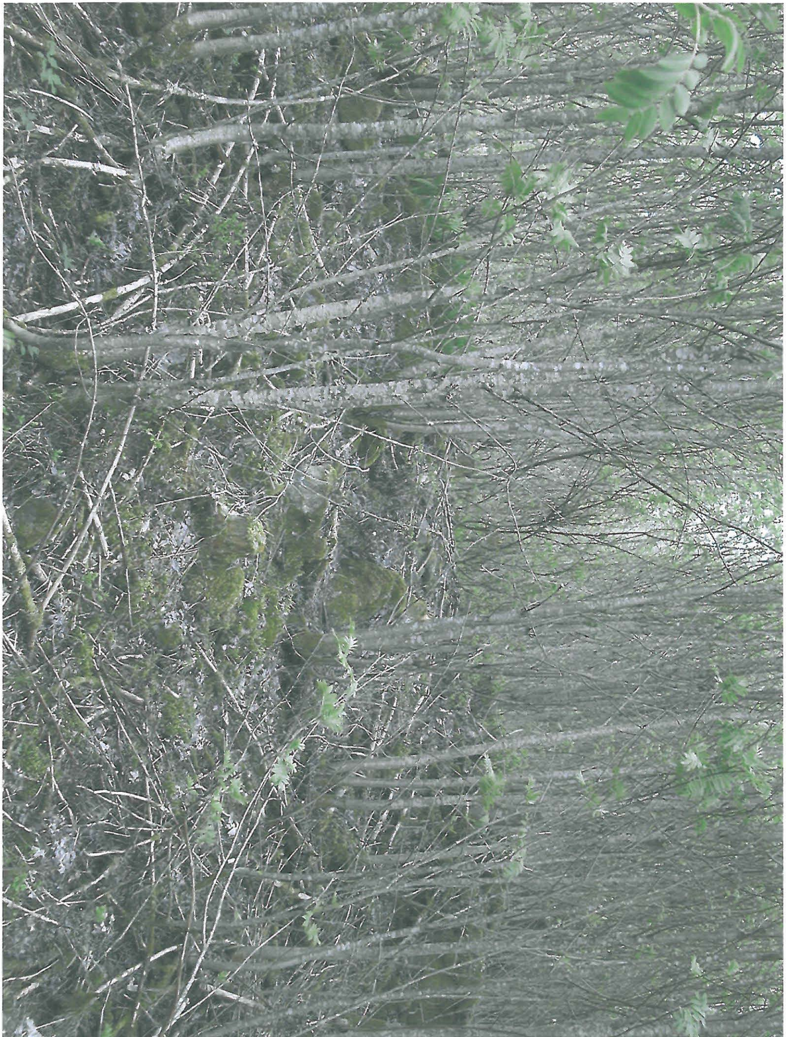
TRUMELA VALKEENIEMI RÖTKEIJÖ 1, OLCI SOINIEN SUUNNASTA NE