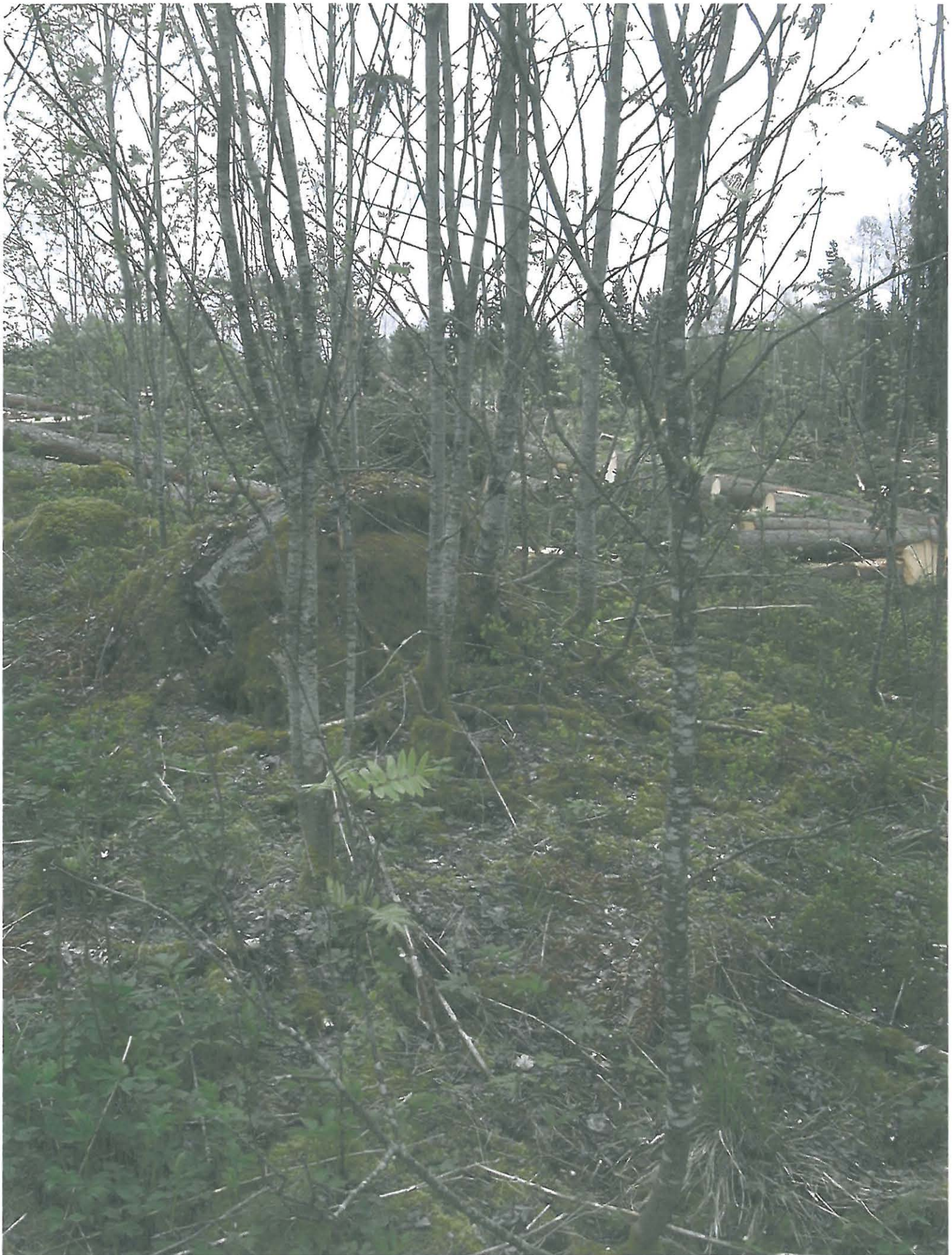
PÄMMEN VALKEEMENI RÖYKÖ 2 - OCCI SOININEN SUUNNASTA NW