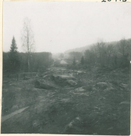
Kuva 1. Etualalla Rупakallion kalmistoa, oikealla Rapolan harju. Pohjoiseen päin.