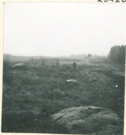
Kuva 5. Mies seisoo kaularenkaan löytökohdassa.