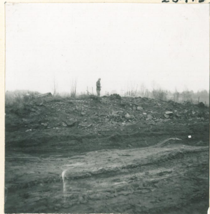
Kuva 4. Mv. Kuuliala kaularenkaan löytökohdalla.