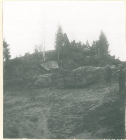
Kuva 2. Rупakallion kalmistoa.