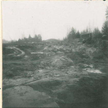
Kuva 3. Kuorittua Rупakallion kalmistoa.