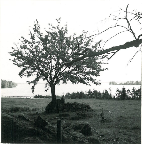
Rapolan kalmiston ruusiorita.