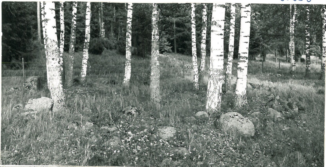
Rapolan kalmiston ruusio ?