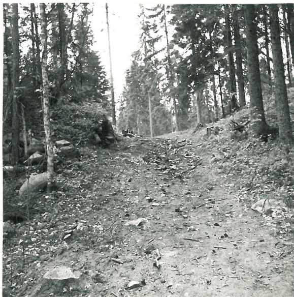
Pi.bottin limnan portti kuvattuna idästä länsiin.