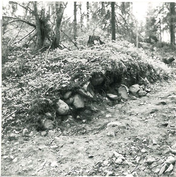
Lapolan limnavallin itäportin eteläreuna, joka on muunnettu auki tukkien ajossa.