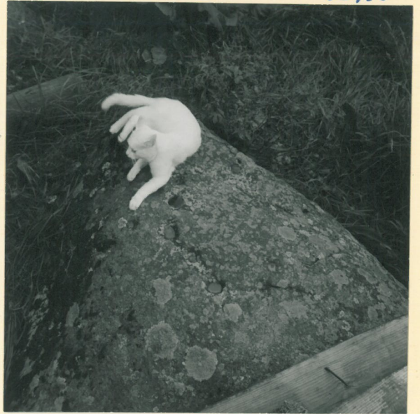
Sama kuin ed.