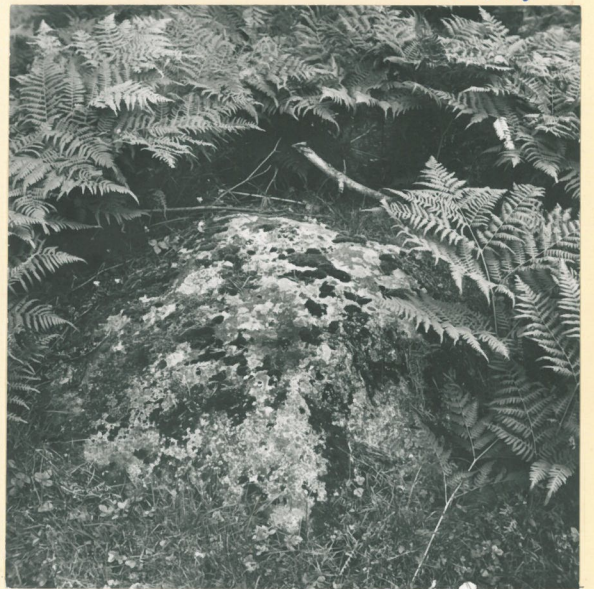
Sääminki, Jüsanmäki, uhrikivi nro 5.