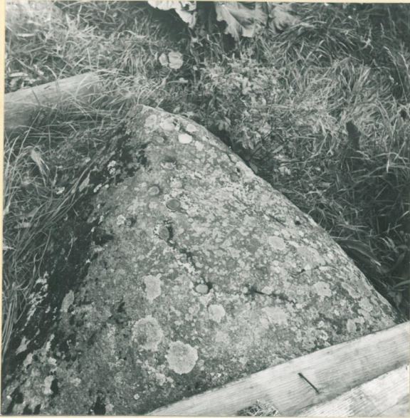
Sääminki, Jüsanmäki, Monola. NRO 3