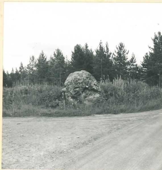
Sääminki, Haapala, uhrikivi, nro 7