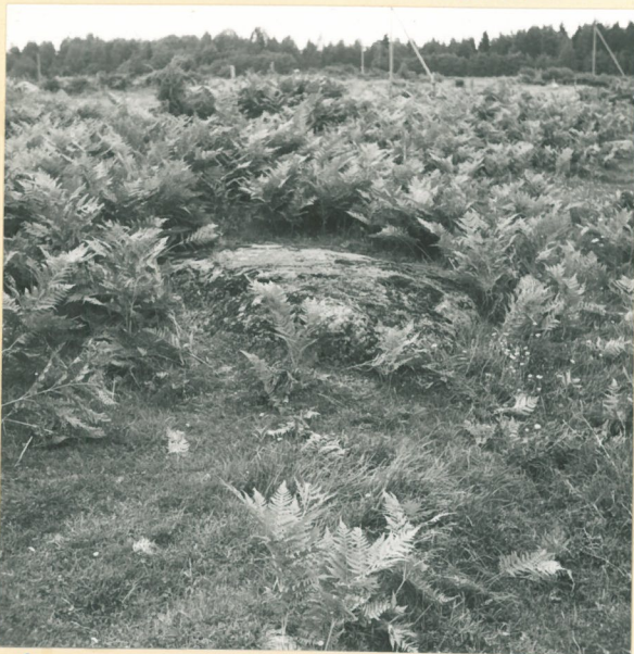
Sääminki, Jüsanmäki, Monola. Uhrikivi nro 4.