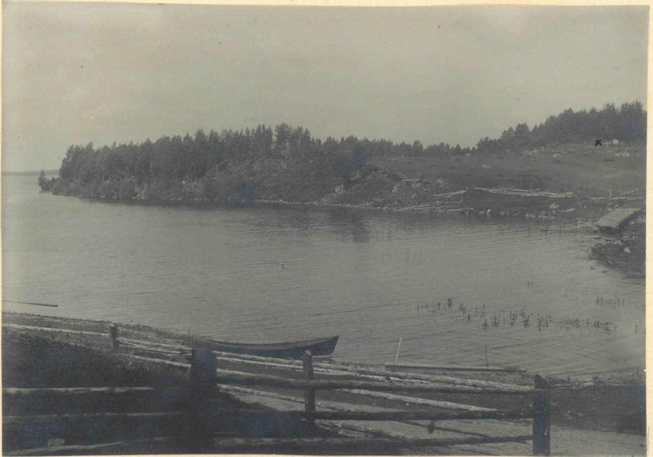
pl. 5338 Supittu viken i Pääjärven. I fonden till höger vid X det av A. Hackman 1919 undersökta röset.