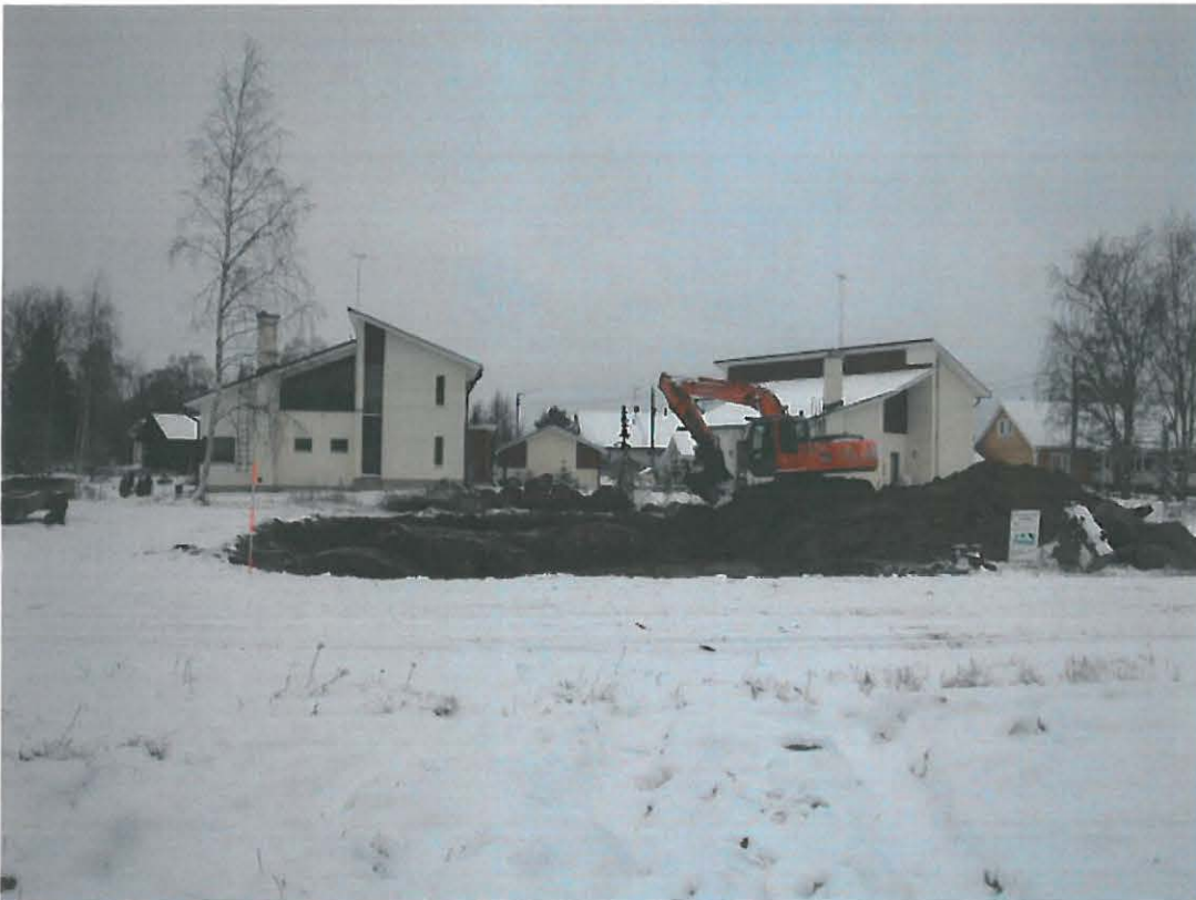
Yleiskuva Loimalankatu 4:n työmaasta idästä kuvattuna.