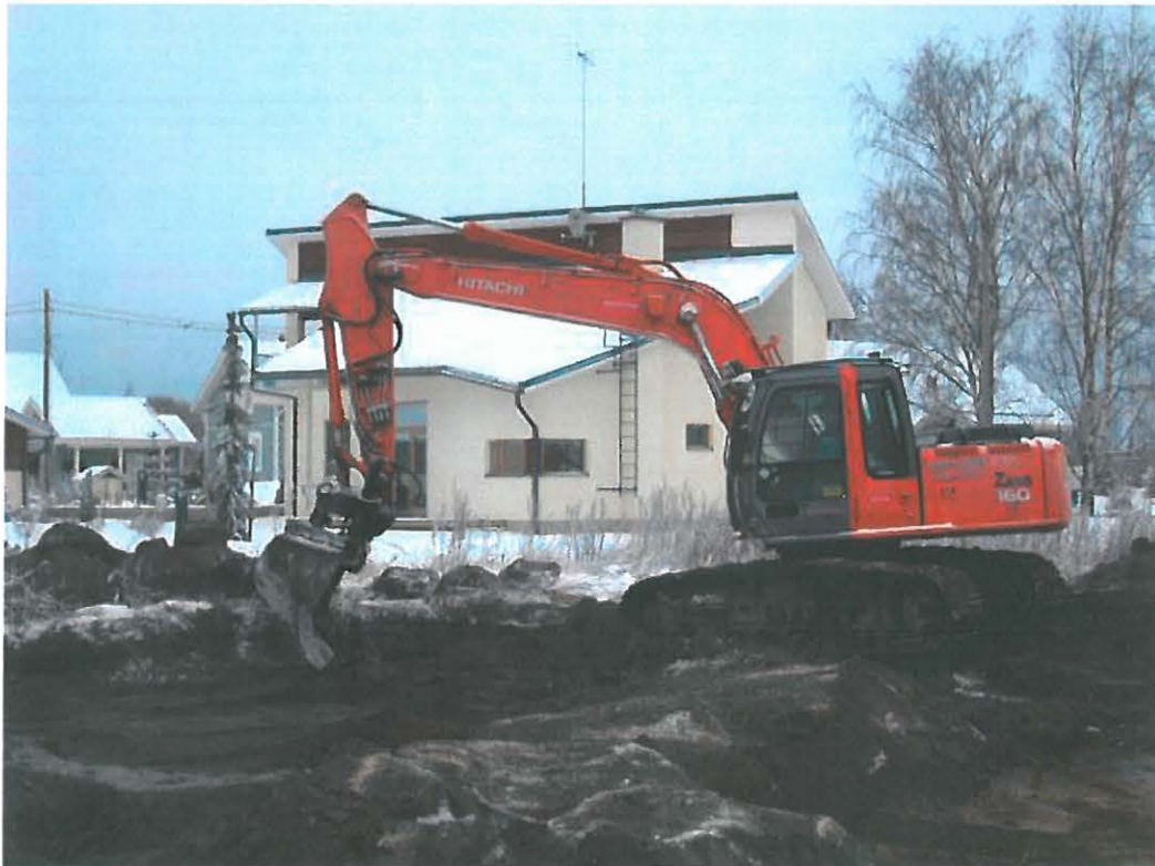
Valvontatyömaa kaakosta, 29.11.2006