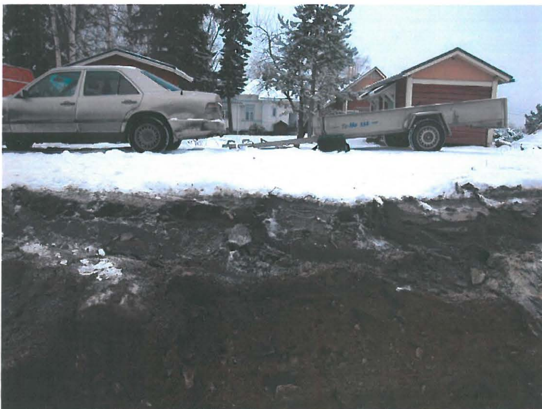
Perustusten kaivannon eteläreuna, leikkaus maakerroksista. Kuvattu pohjoisesta.