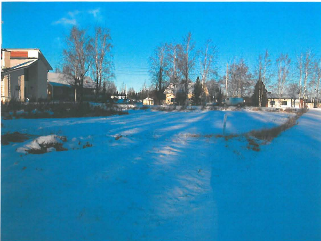
Yleiskuva valvottavasta työmaa-alueesta, kuvattu etelästä. Omakotitalon rakennuspaikka sijaitsee kuvan keskellä vanhan pellon alueella.