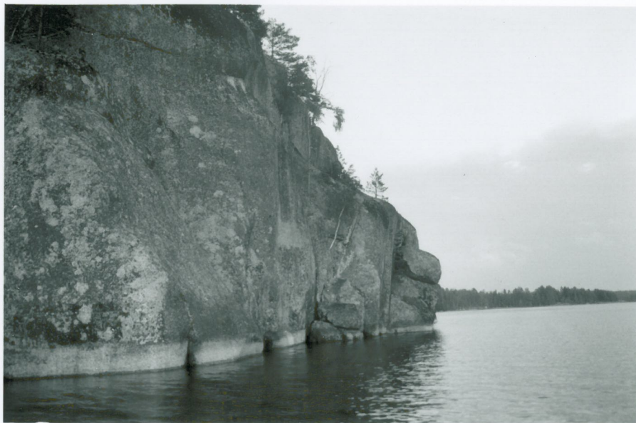
LINTUINVUOREN MAALAUSSKALLIO 30.6. 1999 KUO 22.10, MAALAUSSIKOHTA PYSTYSUORASSA KOHDASSA VAALEASSA LÄIKÄSSÄ N. 4-5 M VEDENPINNASTA, KUUV. KOHTI KAAKKOAA f 113416