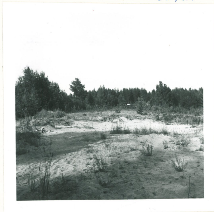
Vaateraman asuinpaikkaa län- nosta, haudat keskellä vaaleassa hiekassa.