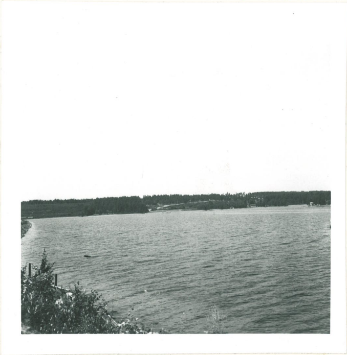
Vaateraman asuinpaikkaa takarannalla keskellä, kuvattu etelästä länteen ylä.