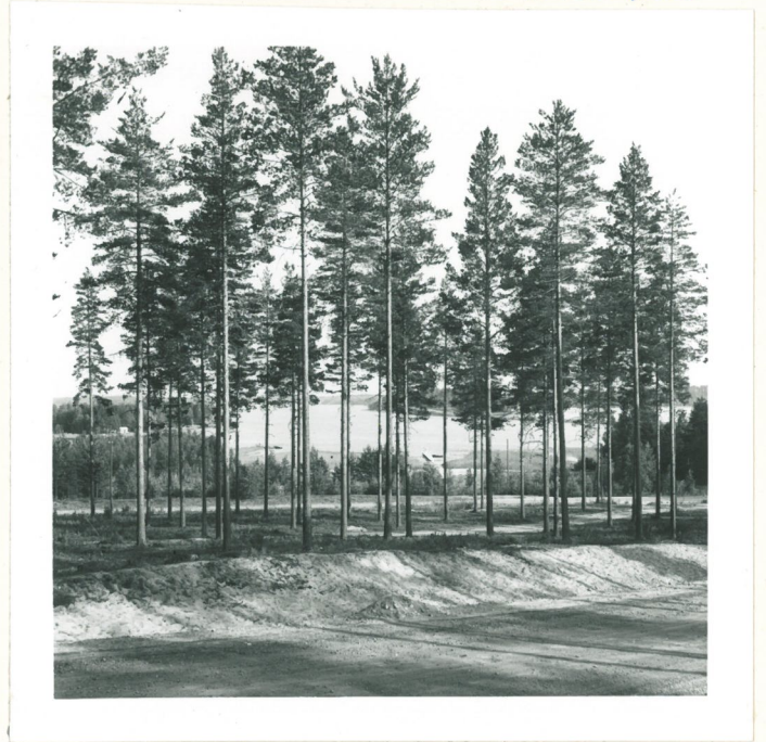
Vaateraman asuinpaikkaa alhaalla tien takana, kuvattu pohjoisesta.