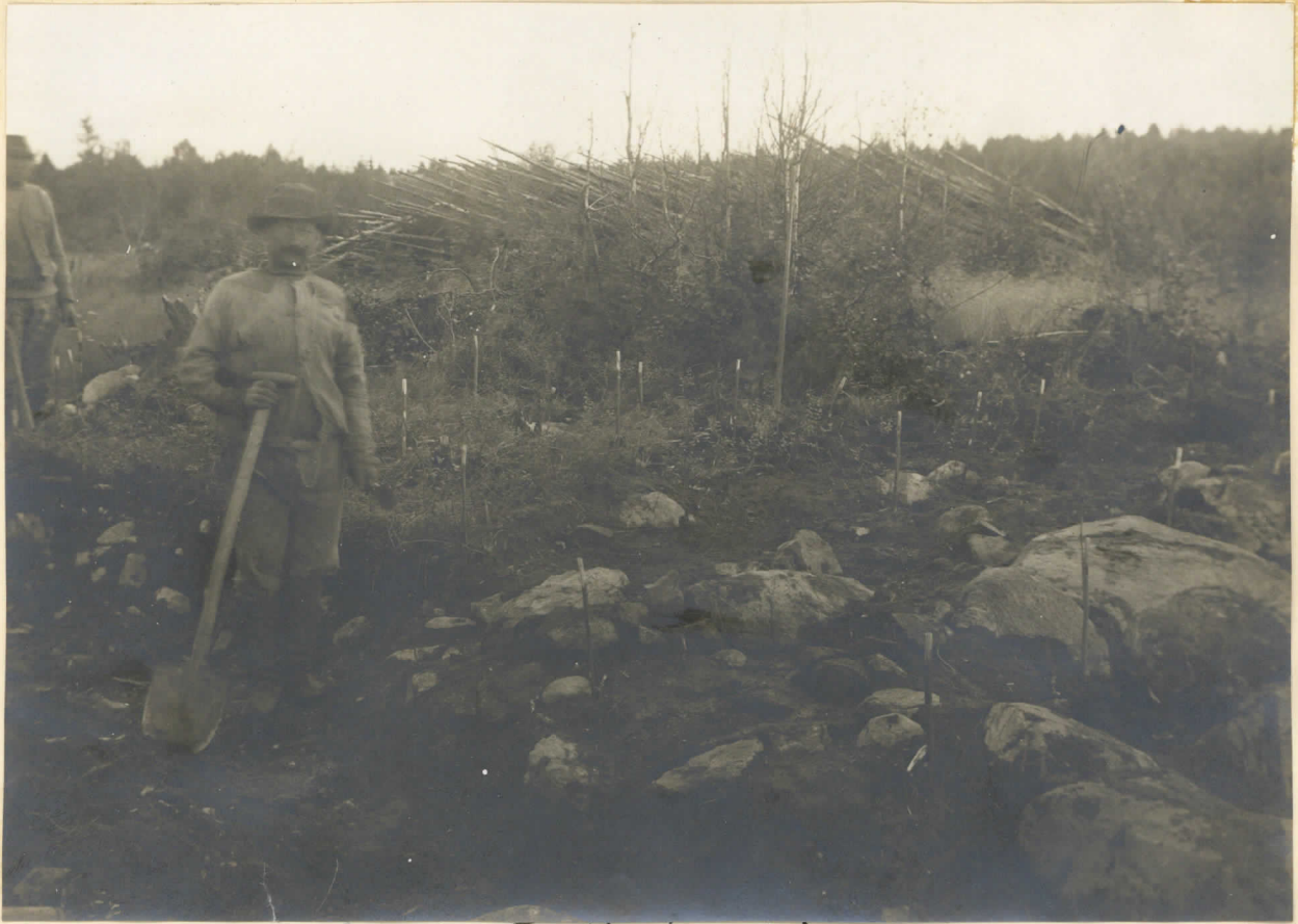
Tulisiijakiveys Säräisniemi, Nimensjärvi, Lillankorva. A. Euroopaentseu Kaivausalueelta v. 1919. Tulisiija kulttuurikerroksen yläosassa ruu- dussa M-N:7-8, valokuvattuna lounasta päin sadeilmalla. Valok. A. Europaens 1919.