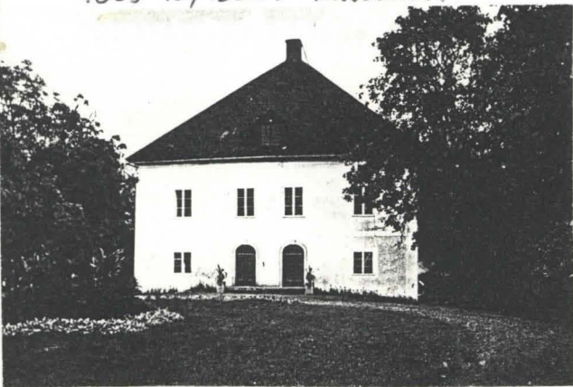
MV hist. kuva-arkisto: en käynyt läpi kuvamateriaalia.

MV RHO kuva-arkisto: KM112966-70, KM115800 = valok.neganot. 7009-10, 18255 = kuvarot.