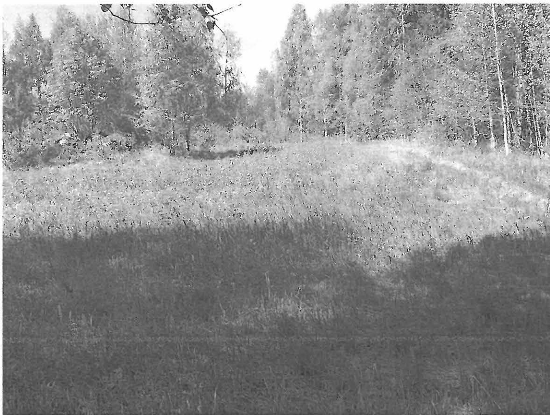
Kuva 1: Pellon itäreunasta kohti länttä (tietä) katsottuna.