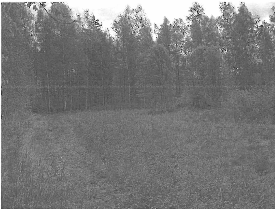
Kuva 2: Pellon pohjoisreuna vasemmalla, kuvattuna kohti itää.