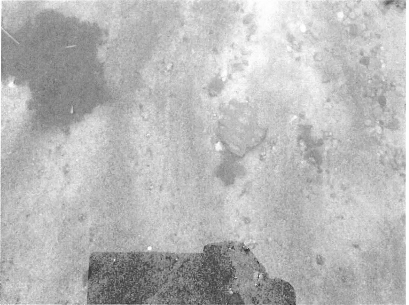
DIGI TERVO PIRTINKAARRE 3.521. Kampakeramiikan palanen rantavedessä.