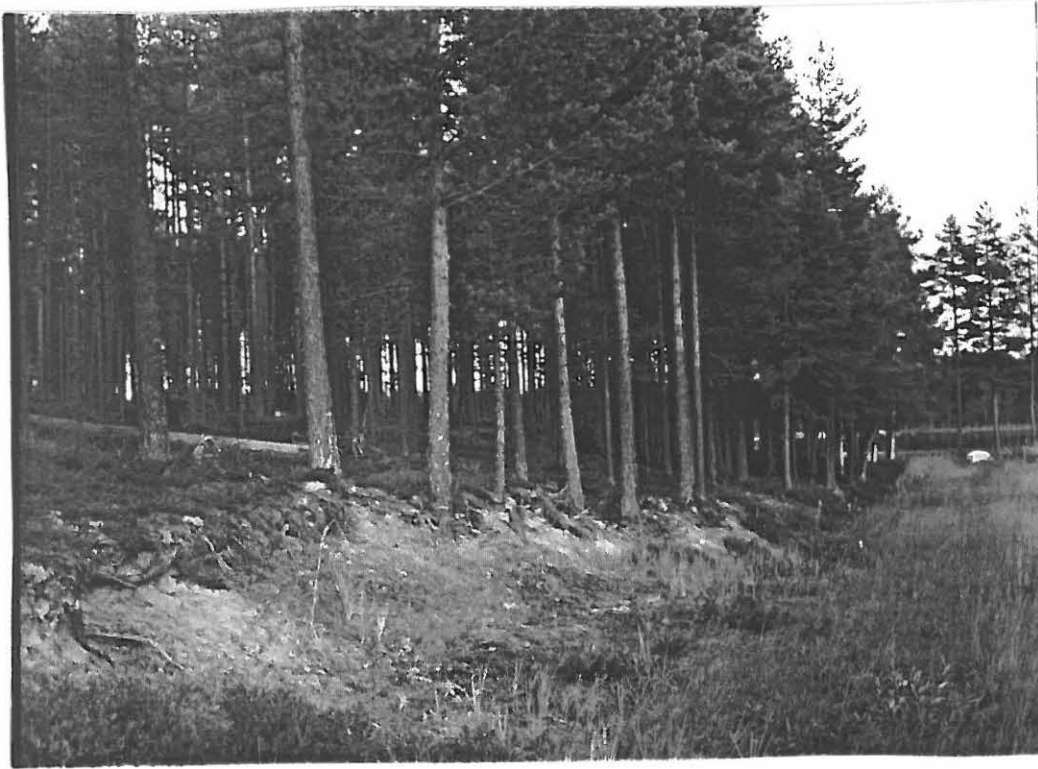
KUVA 3 : PEKKALAN PIHAPELLON RAJOISREUNAA, LOITTONNEE KOHTI OIKEALLA NÄKYVÄÄ PEKKALANLAHTTA, TIE VASEMMALLA KOHOAVALLA KAN-KAALLA. KUVA ITÄÄ KOHTI, RIIKOTULLA MAALLA KVAARTSI-ISKOKSIA