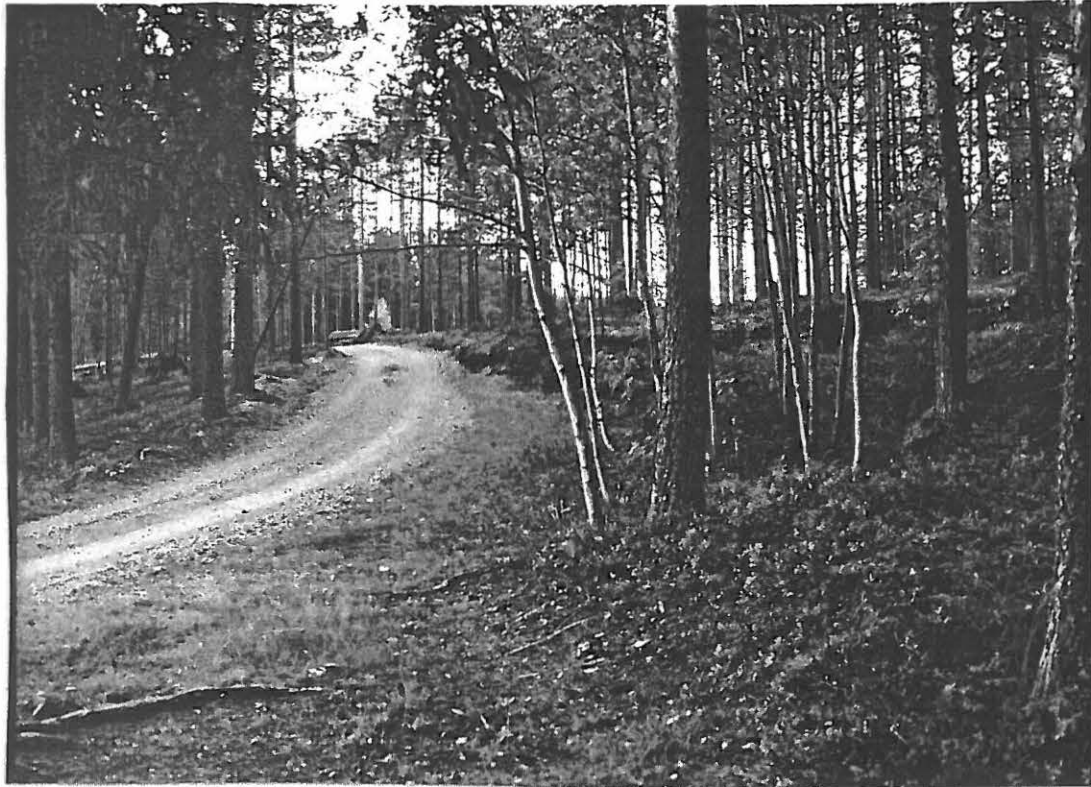
KUVA 1 : KVARTSI-ISKOKSIA MERKKINÄ" ASUINPAIKASTA NÄKYI TIELEIKKAUKSISSA OIKEALLA OLEVAN HIEKKA-KUOPAN YLÄREUNAN TASALLA JATKUVEN VASEMMALLE KANGASMETSÄSSÄ. KUVAN ULKOPUOLELLA AVAUTUVAN PAKETTIPELLON REUNASSA (VRT.KUVA 3) NÄKYI HARVAKSELTAAN ISKOKSIA. PEKKALANTIELLA" KATSOTTUNA PEKKALANLAHDEN SUUNNASTA KOHTI LÄNSI-LUODETTA, 19.9.2003, 6x4,5.