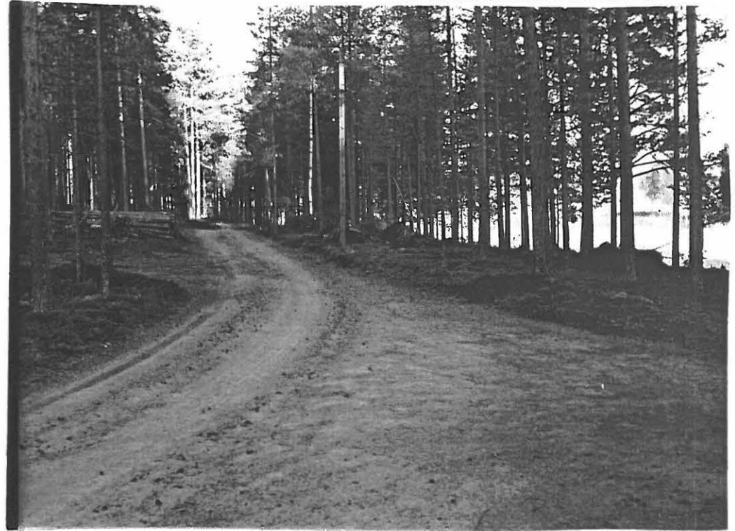
KUVA 2 : PEKKALANTIELLA" KOHTI ITÄKAARON SUUNTA. LÖYTÖTASO LASKEVALLA TIELLÄ", PINON TASALTA LOITOMMAKSI JOHTAVAN TIEN LEIKKAUKSISSA. OIKEALLA PUIDEN TAKANA PAKETTIPELTOA, PUUT SEN TAKANA OVAT PEKKALAN PIHAPIIRISSÄ".