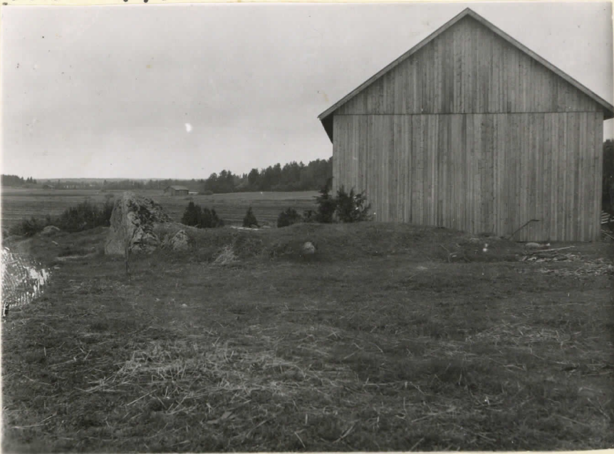
14521. Säiksmäki, Etu Saari, Ruu- ni n:o 35 ennen luttimista. Me- kkinen iso kivi vasemmalla. J. Leppäaho 1947.