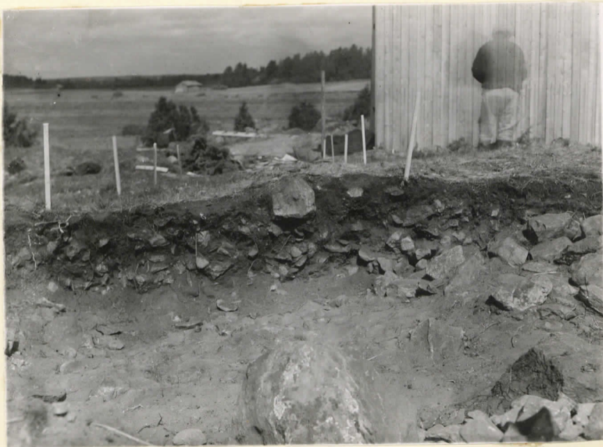
14524. Säiksmäki, Etu-Saari. Profii- litiinja a - b roudujen BII - 8II:n kohdalle. J. Leppäaho - 47.