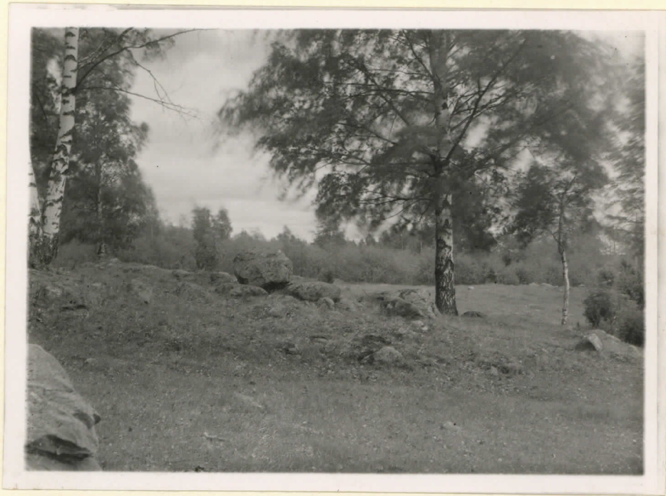
14528. Säähsmäki, Tarhila. Mahtavin Hättimäen kanta- rannioista. Huom! 1-etonin pääinen "banta" rannion keskellä. Valok. suunta ku- takininkin itä. J. Leppä- aho 1947.