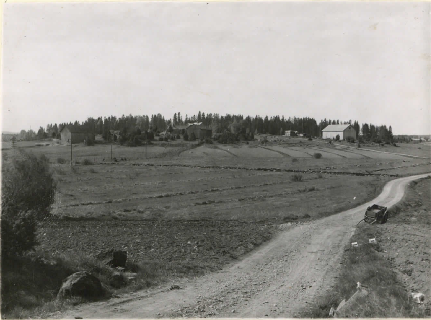
14520. Säiksmäki, Saaren kulmisto Hänttön miehen vaiheilta ja sit- tamen tieltä valokuvatti- kuna. Sunnuntai- ja lauantai- päivä. J. Leppäaho - 47.