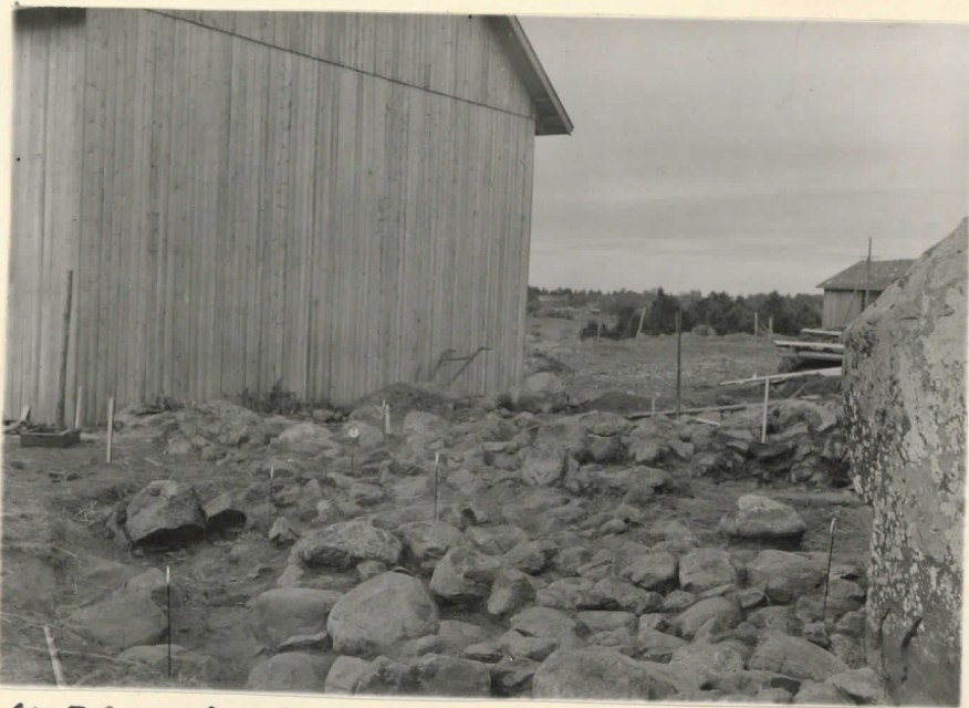
14526. Säiksmäki, Etn-Saari. Ren- nön länsipuoleisen uun kivitys paljastettuna. Valok. suunta koilli- nen. J. Leppäaho 1947.