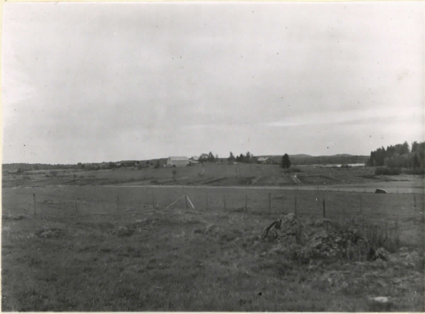
14519. Säiksmäki, Saaren kulmisto Sillantaan talon vaiheilta eli luoteen puolelta valokuvatti- kuna. J. Leppäaho - 47