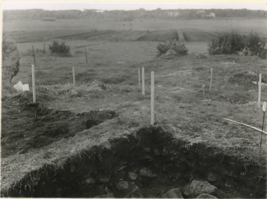
14523. Säiksmäki, Etu-Saari. I kivanssektoria kolmannes. J. Leppäaho 1947.