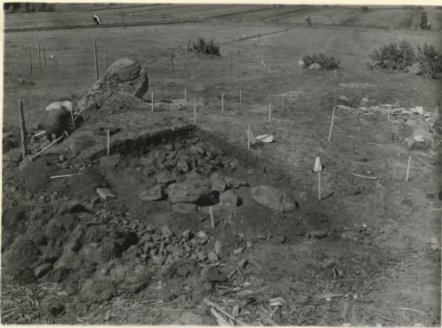
14522. Säiksmäki, Etu-Saari. I kivanssektori eli roudut 8II- DII. Suunta länsi. J. Leppäaho 1947.