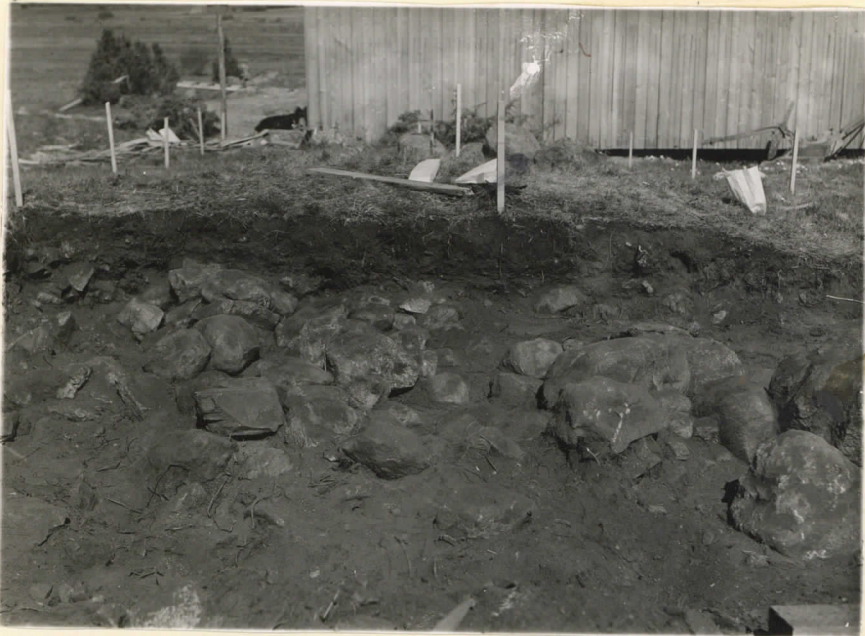
14525. Säiksmäki, Etn-Saari. Pro- fiihtilinjä a-b runtojen BII-DII:n kokoalla. J. Leppäaho 1947.