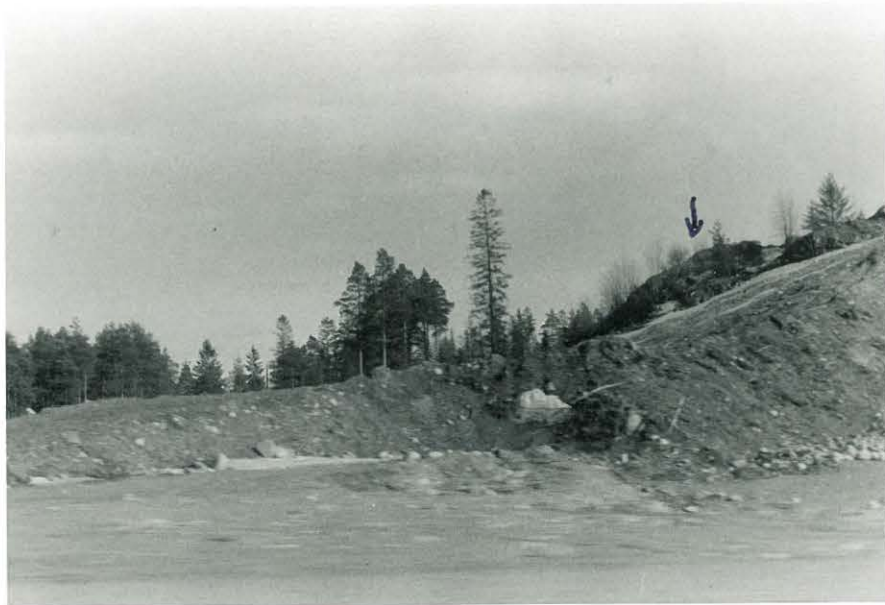
1. Työntömulttakasa pääsisäisenä 1971. Kuva otettu Juvankadulta käsin.