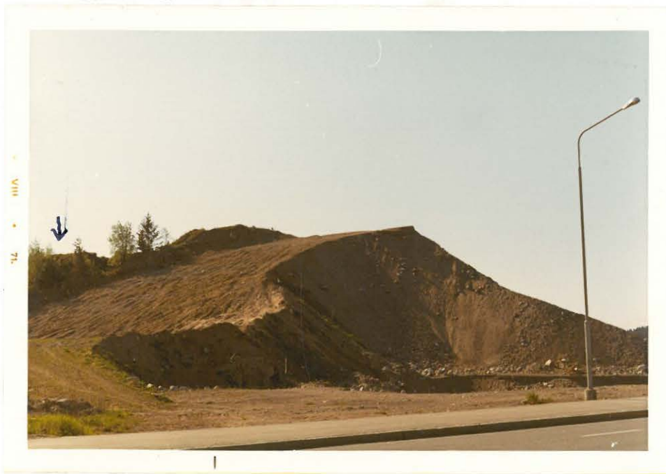
2. Työntömulttamäen yläosa vas. laidassa. Oik. kaupungin sorakuopan reunaa, etualalla Juvankatua.