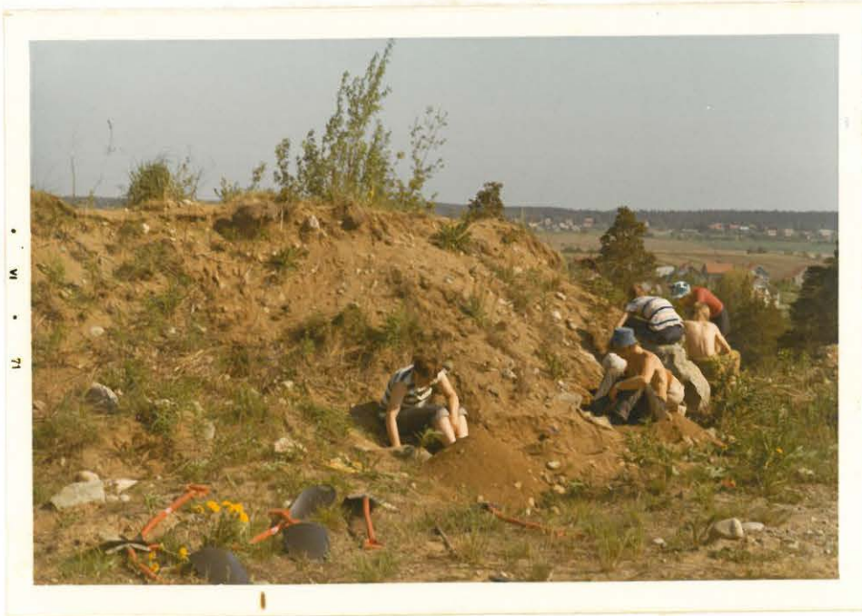
3. Työntömultamäen ylin töyräs, josta tutkiminen aloitettiin. Oik. alakulmassa näkyvä tasanne on harjun lakea, jonka päältä kalmiston sisältänyt pintamaa oli ajettu harjun rinneelle.