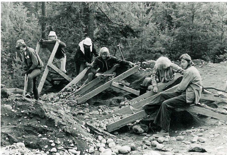
11. Pieni koneseula käytössä: yksi la- pioi maata seulaan, toinen poimii suu- rimmat esineet kourusta ja kolmas pienemmät kourun alle pannusta käsiseulasta.