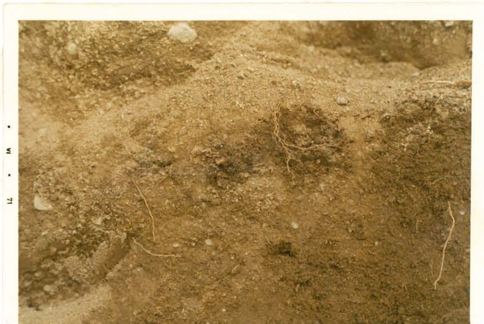
4.-5. Epämääräisiä tummia läiskä oli siellä täällä maan seassa.