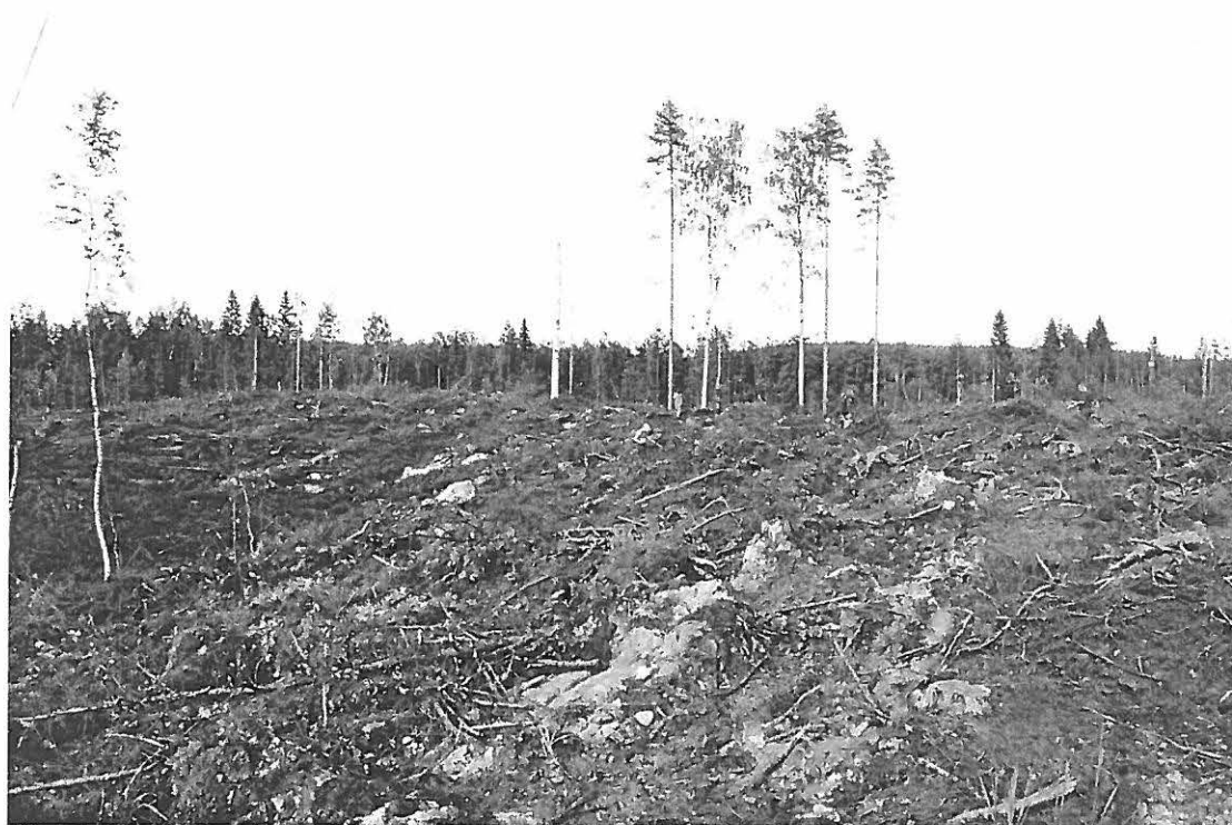
Äestetty muinaisjäännösalue. SW-NE (f. 143523). Kuvannut P. Pesonen 2006.