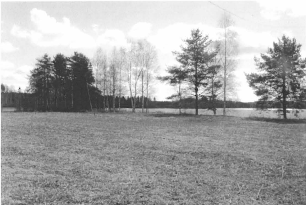
Rantasaunan perustusten kaivuun valvonta 24.04.2003