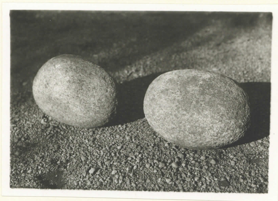
De två äggformiga stenarna från stensättningen på Soldat - Stomparen.