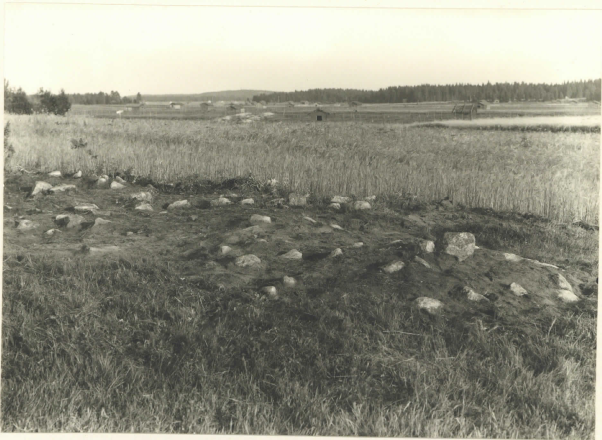
Stensättningen på Soldat - Stomparen. levy 12681.