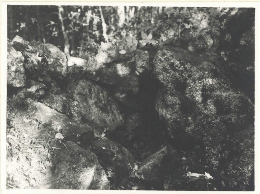
„Ugnen“ i stensättningen på Erik Ehrs' hov.