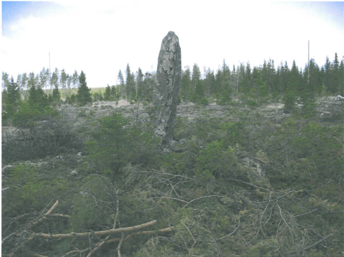
Kuva 4. Ylempänä rinteessä, asuinpaikan länsipuolella sijaitseva rajamerkki.