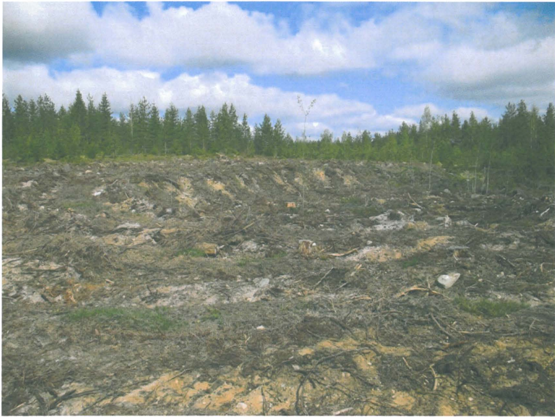
Kuva 3. Vanhaa hiekkakuopan reunaa.