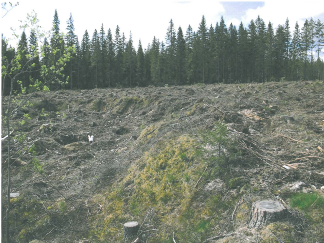
Kuva 1. Asuinpaikka-alue sijaitsee vanhan sorakuopan ympärillä ja jatkuu lähes kuusimetsään asti.