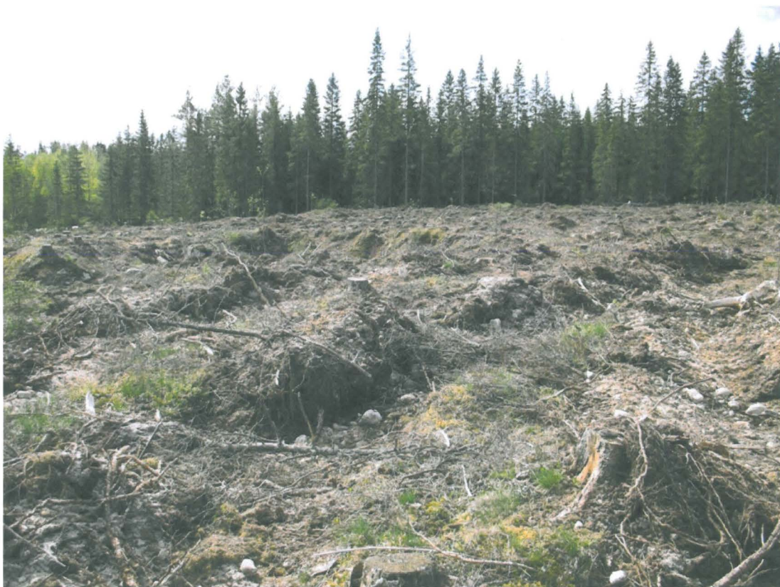
Kuva 2. Äestysurista pisti esiin runsaasti kvartsi-iskoksia.