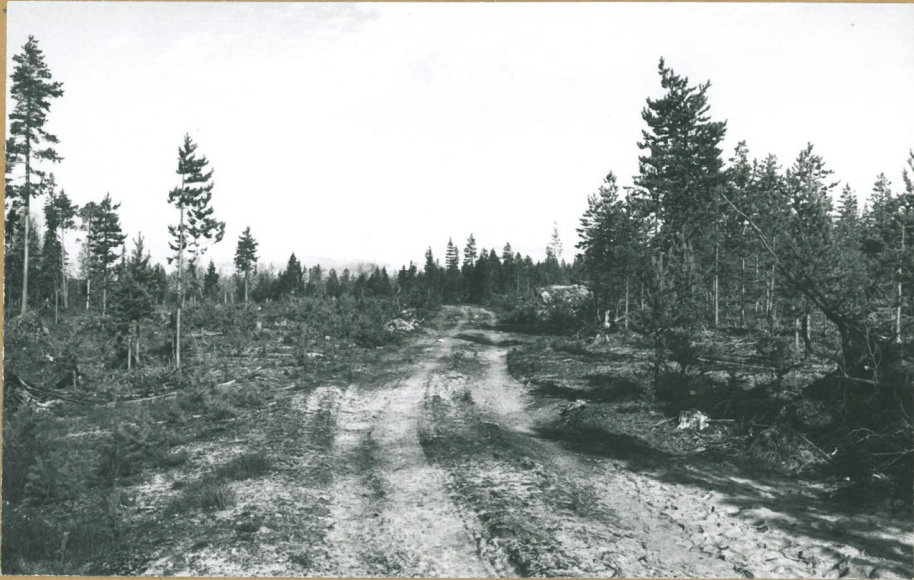
F. 69007 Sirkonkankaalle vievä tie. Kvartseja ja liusketta löytyy tien pinnasta. Etelästä.