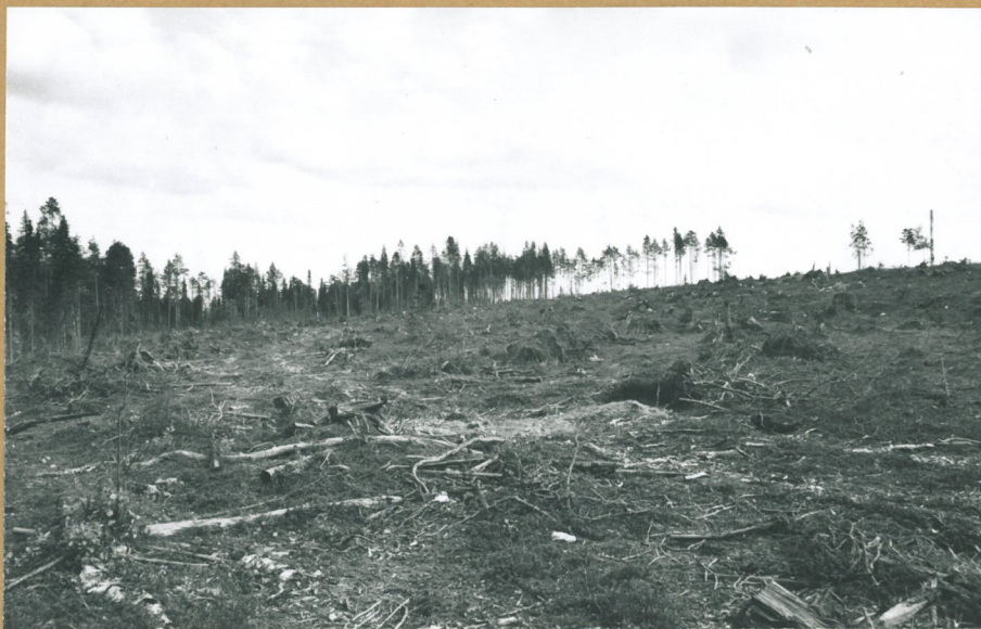
F. 69005 Hakattua sukkaa Sirkonkankaan keskiosassa. Kes- kellä peitetty asuinkuopanne. Lounaasta.