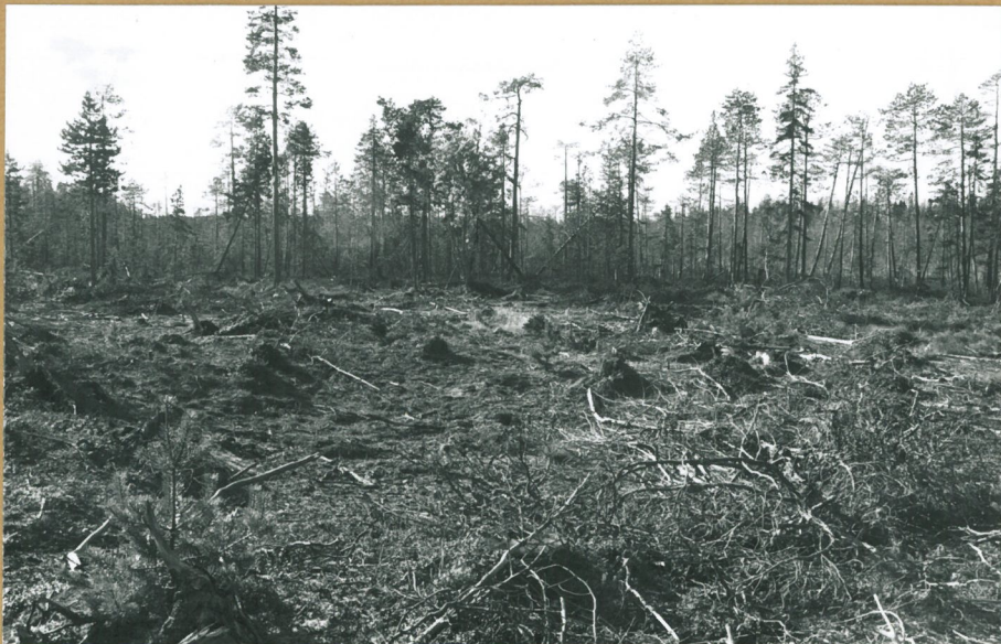
F. 69008 Kyseisen metsätien vieressä oleva asuinkeppä koillisesta.