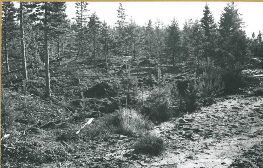
F. 69009 Sama. Asuinkeppä on puoliksi peittyneet tien alle. Luoteesta.