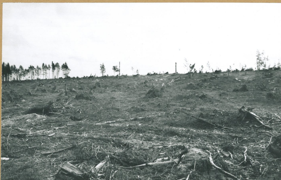
F. 69006 Metsätraкторitie kulkee yli asuinkuoppien. Sirkon- kankaan keskiosa. Lounaasta.