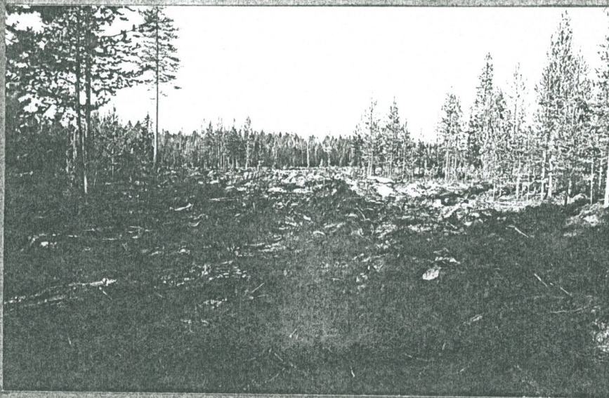
Em. alue a lounaasta.