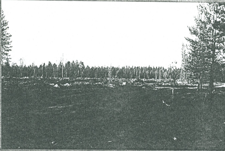
Auraamalla kevätkesällä 1987 tuhottua asuin- kuoppa-aluetta a. Vasemmalla kuoppa 25. Etelä- kaakosta.