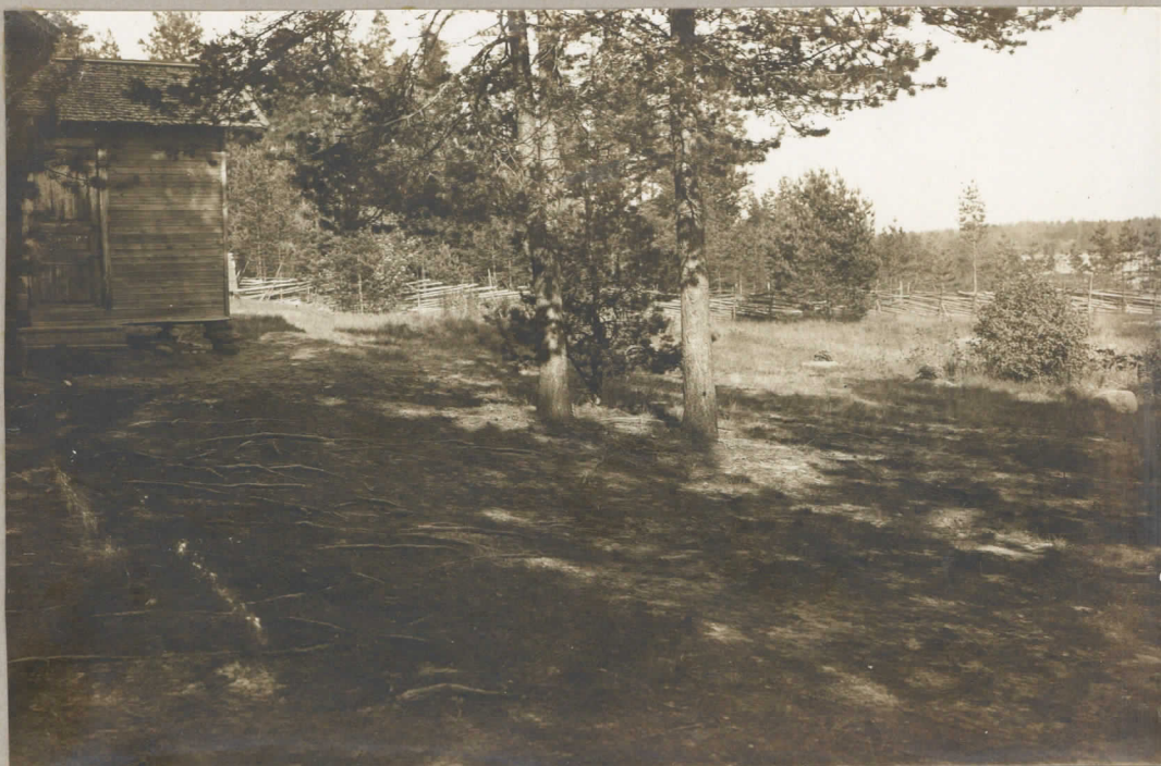
Sama alue jostakin W. suunnasta (aidan takana kuvassa vasemmalla, kaivolla koelaudalla) keuhalla 1930.