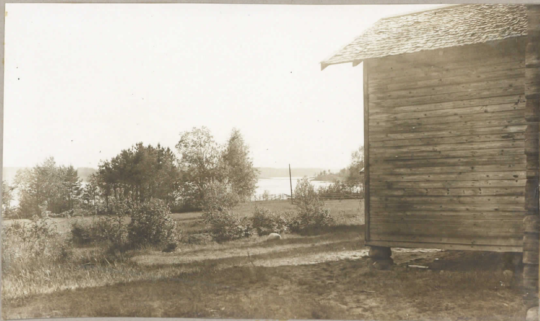
Sama alue E.N.E. suunnasta