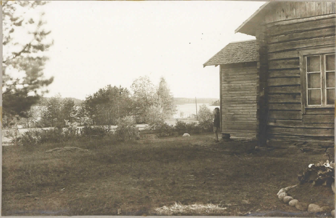
Pöytäsen perillisten huvila-alue N.E. suunnasta valokuvattuna.

Taipalsaaren Vaaterannan Kivikautinen asuinpaikka.