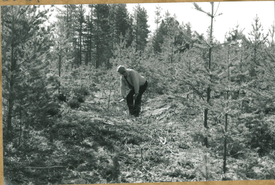
LÖYTÖALUE B, KODANPOTIJA PAIMANTIEZT, ANTI SAARI KUOPAN KESKELI.