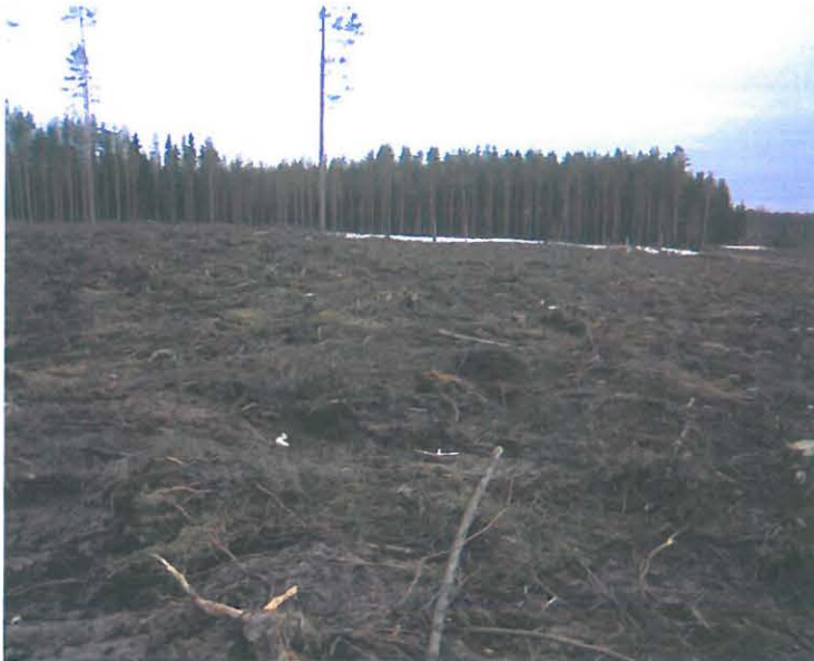
Järventauksentien itäreunan hakkuaaluetta pohjoisesta katsottuna. Honkakangas on metsässä taustalla, samoin Vt 17(vas>Joensuuhun, oik>Kuopioon)