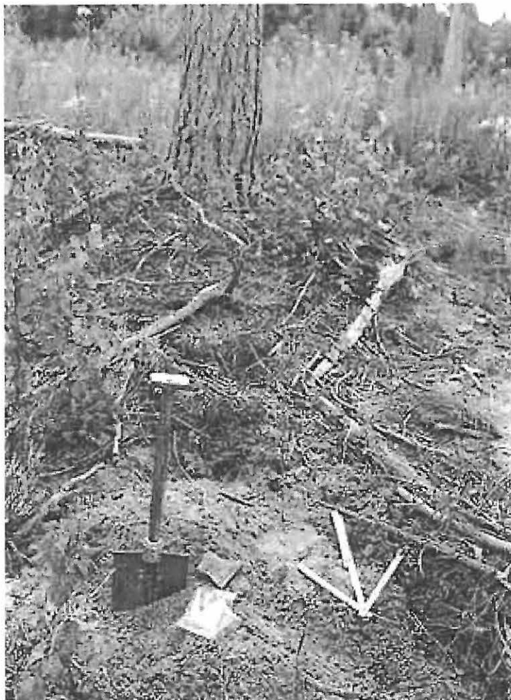
F.a. 4326 KUVA 2: Löytökohta (KM 32919) kumpareella valokuvattuna koillisesta.