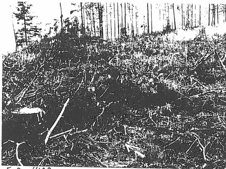
F. A. 4103

KUVA 1 : KIVKONNIEMEN ITÄISIN REUNA KUVASSA OIKEALLA, KUVAN LÖYTÖPISTE ON N. 25 M RANNASTA, PYSSYNPERÄ-LAH- DESTA VASEMMALLA, NÄHTYNÄ LOUNAASTA PÄIN. VALOK. JOUKO ARDALHO, 10.10.1998, 6x4,5.