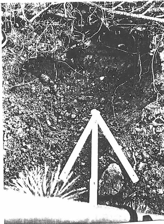
F. A. 4104.

KUVA 1 : KIVKONNIEMEN ITÄISIN REUNA KUVASSA OIKEALLA, KUVAN LÖYTÖPISTE ON N. 25 M RANNASTA, PYSSYNPERÄ-LAH- DESTA VASEMMALLA, NÄHTYNÄ LOUNAASTA PÄIN. 10.10.1998, 6x4,5.