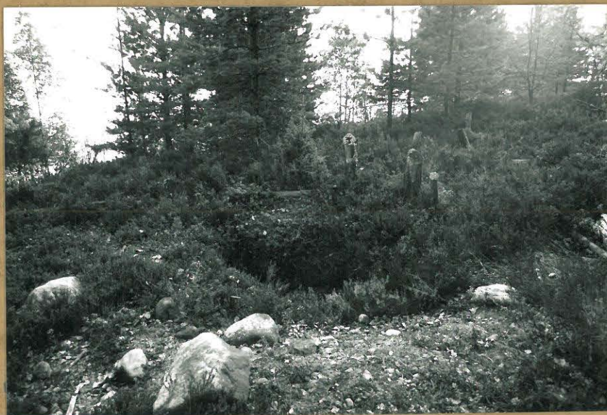
Uusia Laitosaaren hautoja on kaivettu myöhemmin.