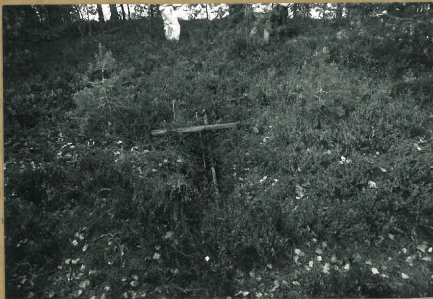
Hautakuoppa Laitosaarella. Paikalta haraittiin 15 kpl. samanlaisia hautakuoppia.