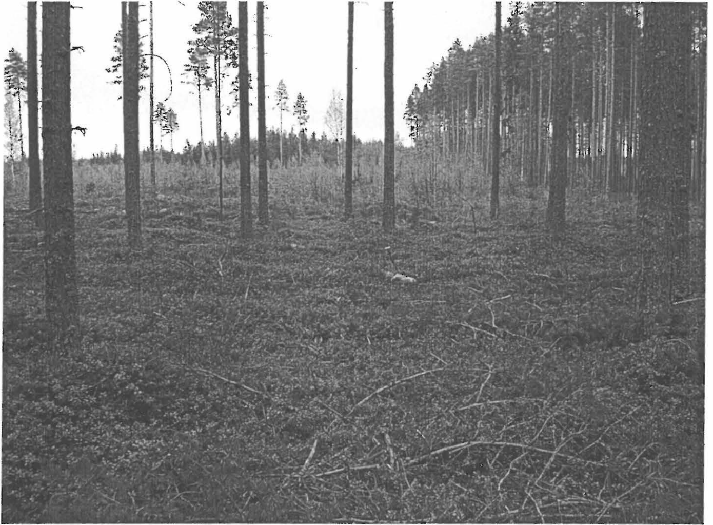
Asuinpainanne länsiluoteesta kuvattuna. Kvartsit ja palaneet kivet etualan koekuopasta.