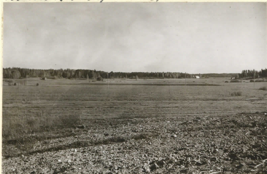
Levy 11571. J. L. 1936. Kuva kuin edellä, mutta suunta on etelä.