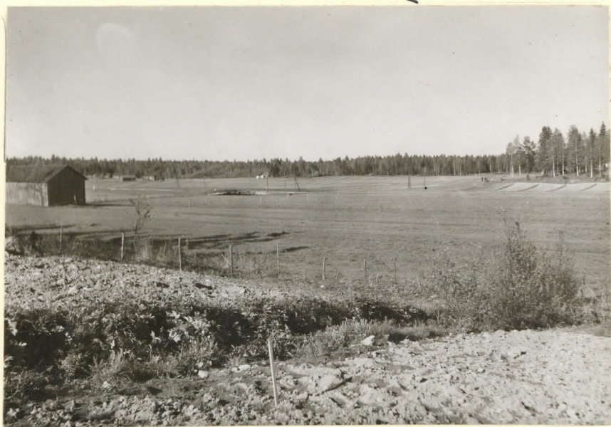
Levy 11570. J. L. 1936. Näköala Tuusulan pitäjän Nissbachan kylän Eskeli- nin talon maalla ole- valta kivikautiselta -asuinpaikalta koillis- suuntaan. \sim = mahdol- lisen sulkuvuodon paikka.