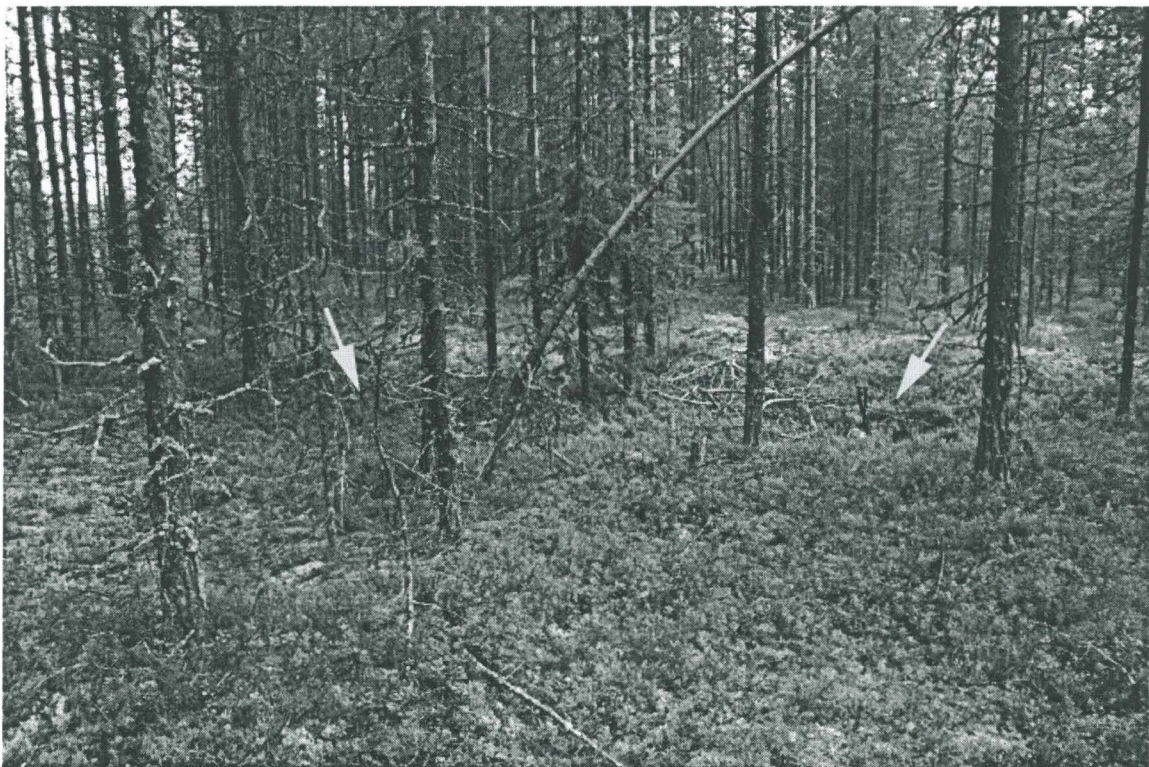
Kuva 4. Asuinpainanne 3 eli ns. 'paritalo' poikittaisakselin suuntaisesti. Nuori kuusi painanteen puolittavan matalan vallin kohdalla. Nuolet osoittavat asuinpainanteen pohjois- ja eteläosan 'asuntoja'. Kuvattu lännestä.