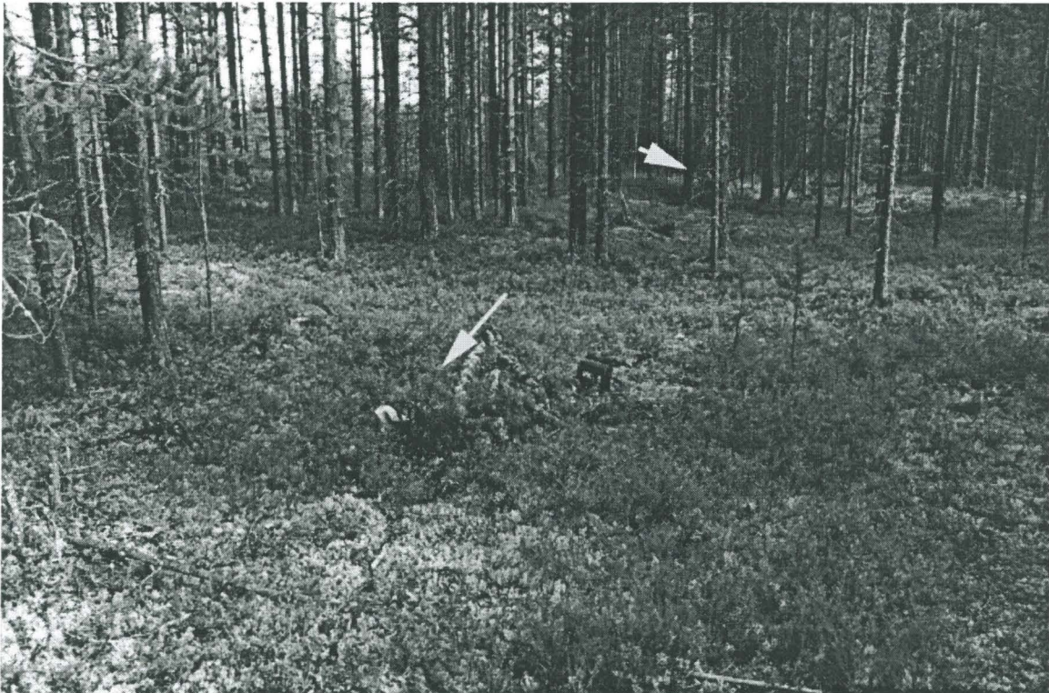
Kuva 2. Asuinpainanne 2. Etualan nuoli osoittaa asuinpainanteen keskikohtaa. Taustalla (lyhyt nuoli) FM Jalo Alakärppä kaivaa koekuoppaa asuinpainanteeseen 3. Kuvattu länsi-lounaasta (Kuva: Janne Ikäheimo. Oulun yliopisto, Arkeologian laboratorio 9/43/4/12).