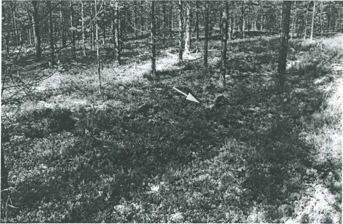
Kuva 1. Asuinpainanne 1. Nuoli osoittaa asuinpainanteen keskikohtaa. Kuvattu etelä-kaakosta.