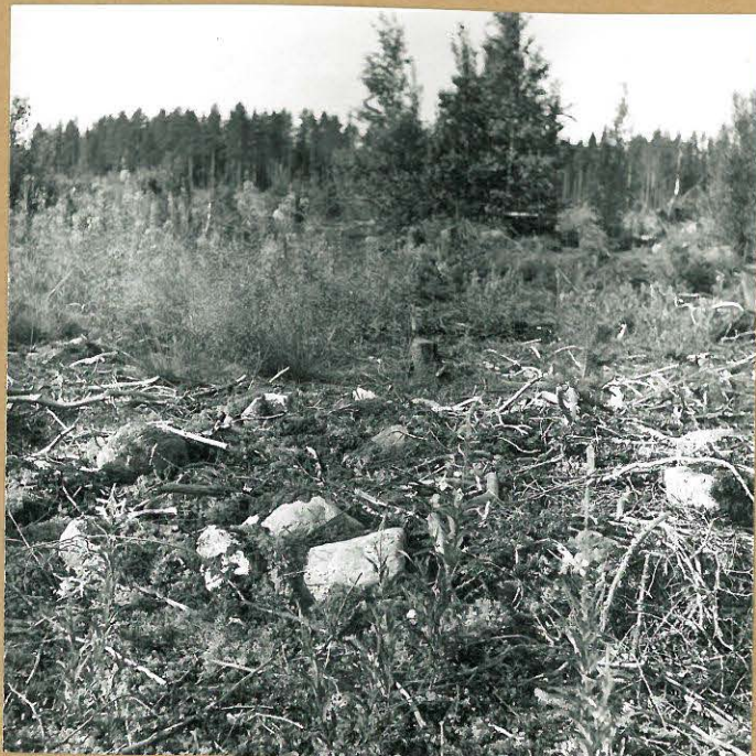
RAMABACKA SKL (4)