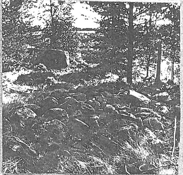
MICKELSBACKA SKL (3)