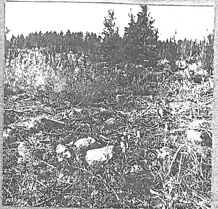
RAMABACKA SKL (4)