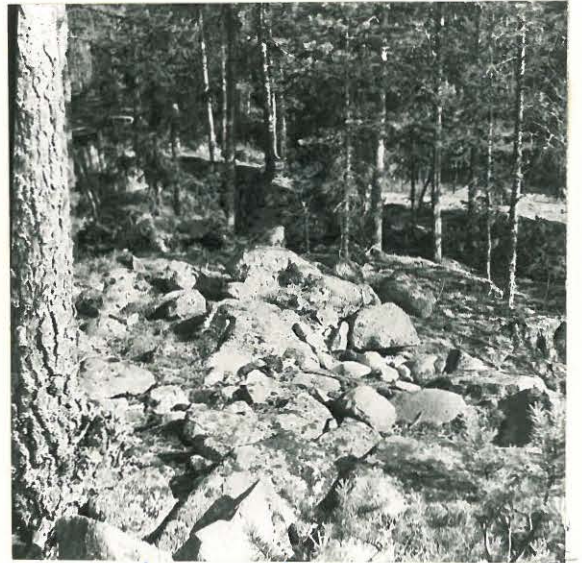
Sama kuin ed.