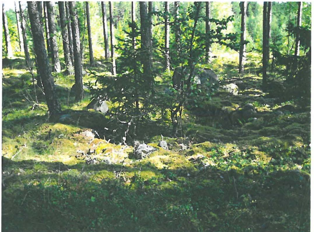
10. Uusikaupunki Savio. Luonnonkivikossa oleva neliskulmainen rakkakivikuoppa. Kuvattu etelästä. DT2009:32:11:kuva 004