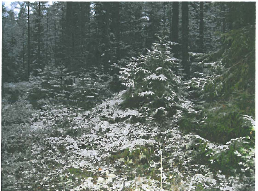
8. Uusikaupunki Savio. Kaakon puoleinen maakumpu c, jonka sisällä kuoppa. Kumpu d sen takana. Kuvattu etelästä. DT2009:32:11:kuva 032