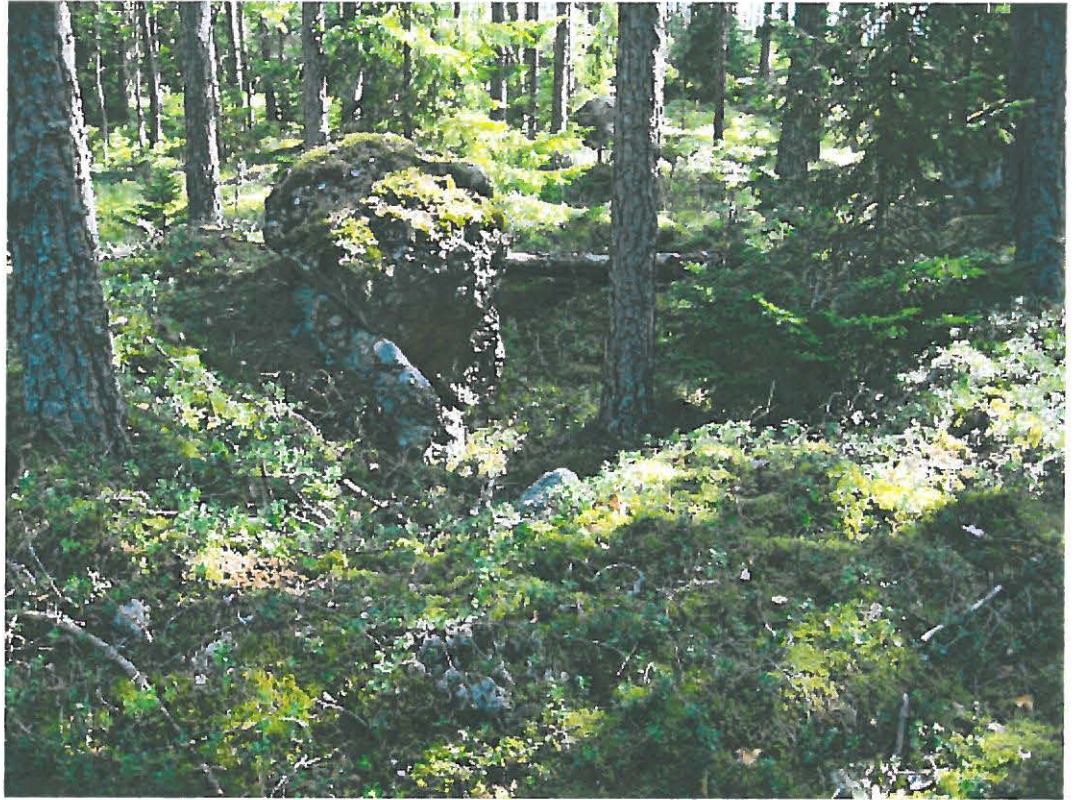
1. Uusikaupunki Savio. Vallin ympäröimä maakuoppa a lounaasta kuvattuna. Etualalla mahd. sisäänkäynti. DT2009:32:11:kuva 005