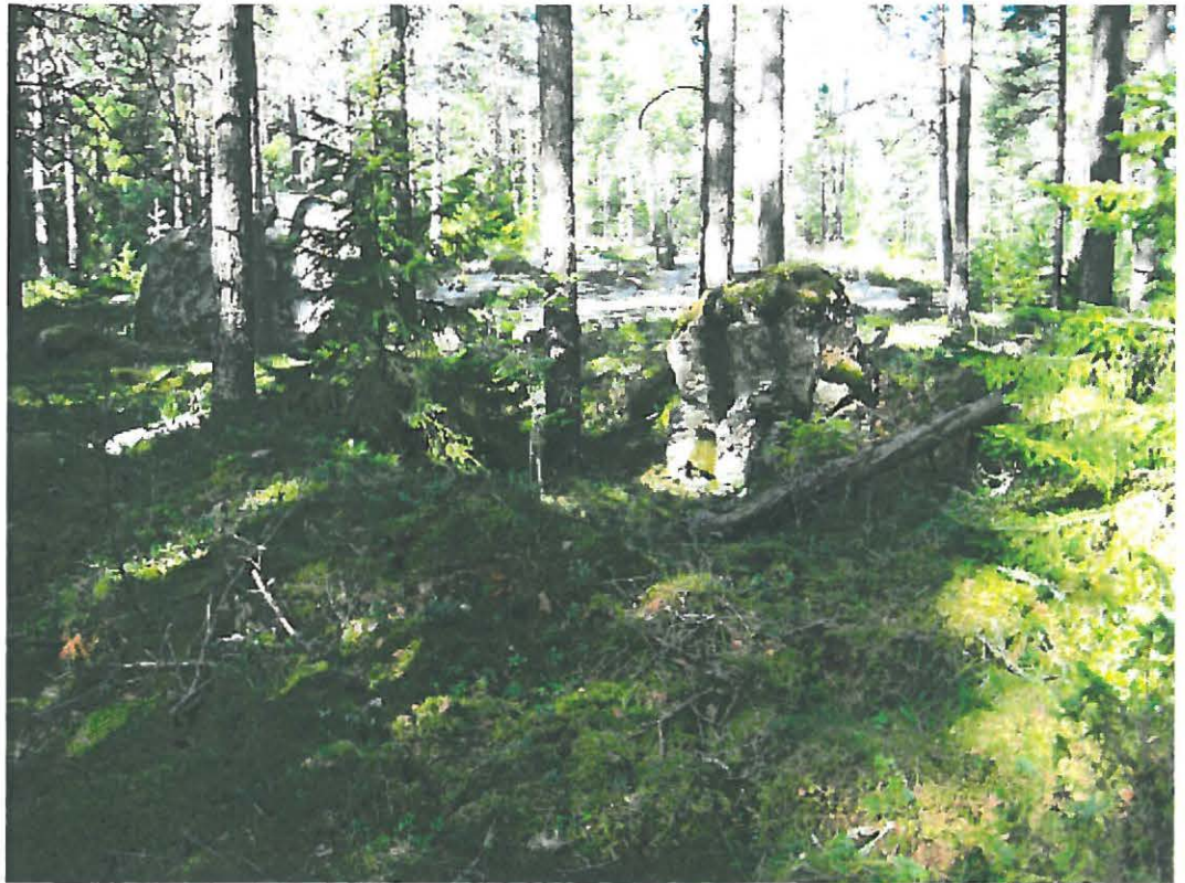
3. Uusikaupunki Savio. Vallin ympäröimä maakuoppa a itä-koillisesta kuvattuna. Taustalla kalliopaljastumaa ja siirtolohkareet. DT2009:32:11:kuva 008