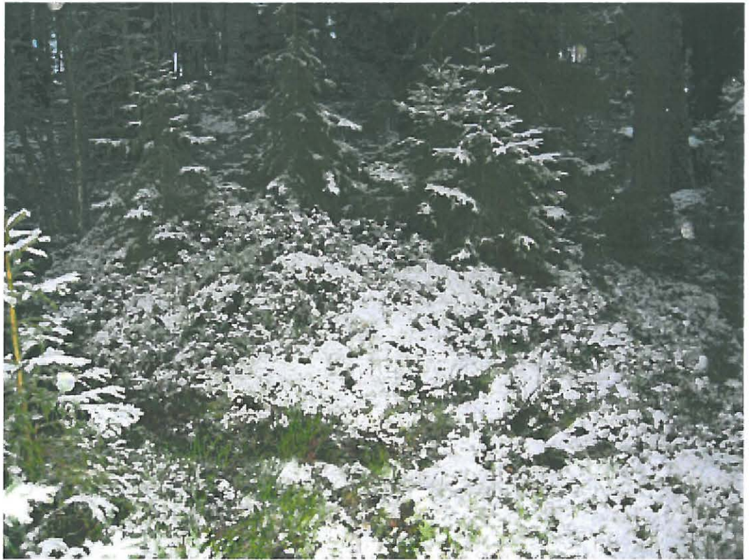
7. Uusikaupunki Savio. Kaakon puoleinen maakumpu c, jonka sisällä kuoppa. Kuvattu luoteesta. DT2009:32:11:kuva 031