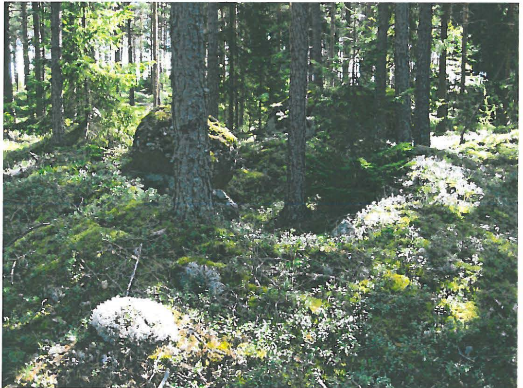
2. Uusikaupunki Savio. Vallin ympäröimä maakuoppa a länsi-lounaasta kuvattuna. DT2009:32:11:kuva 007