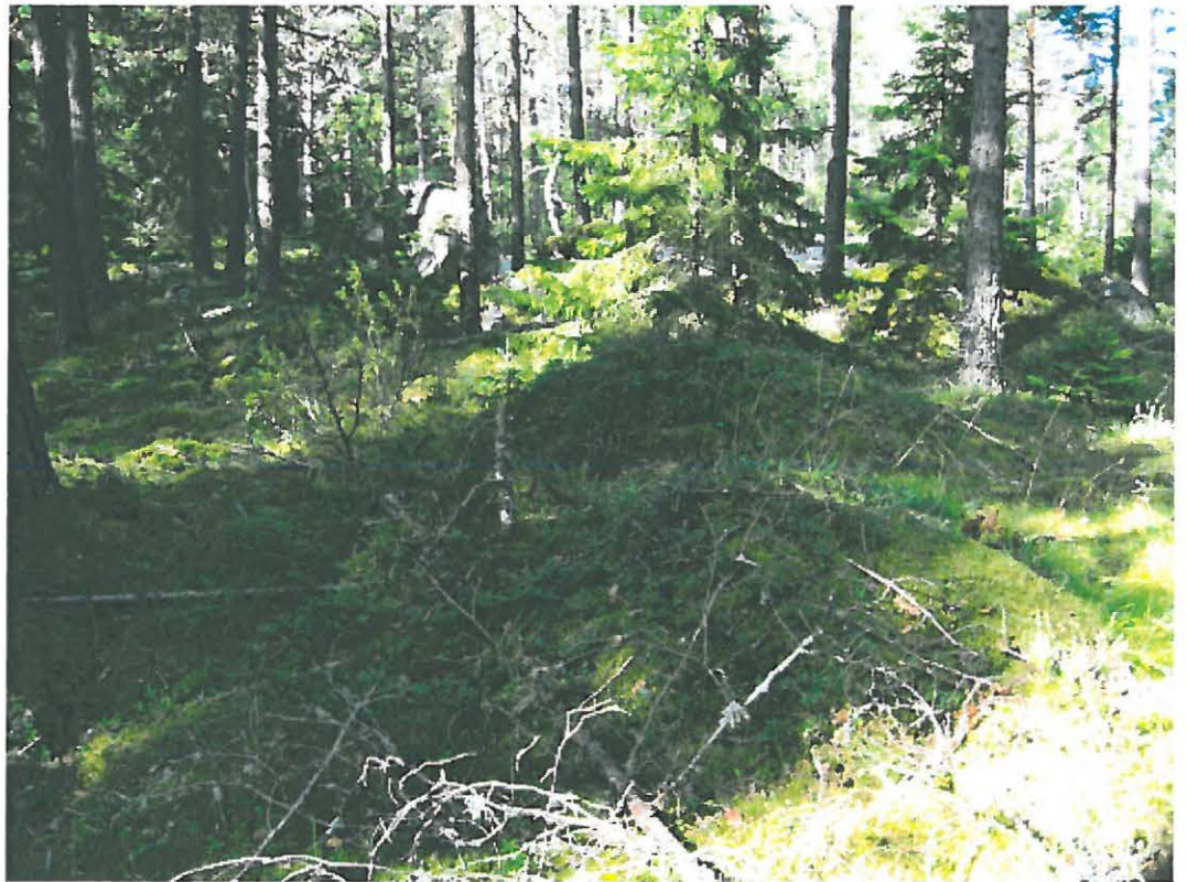
4. Uusikaupunki Savio. Vallin ympäröimän maakuoppa a:n pohjoisnurkan ulkopuolella olevat kaksi pienehköä maakumpua etualalla. Kuvattu pohjoisesta. DT2009:32:11:kuva 009