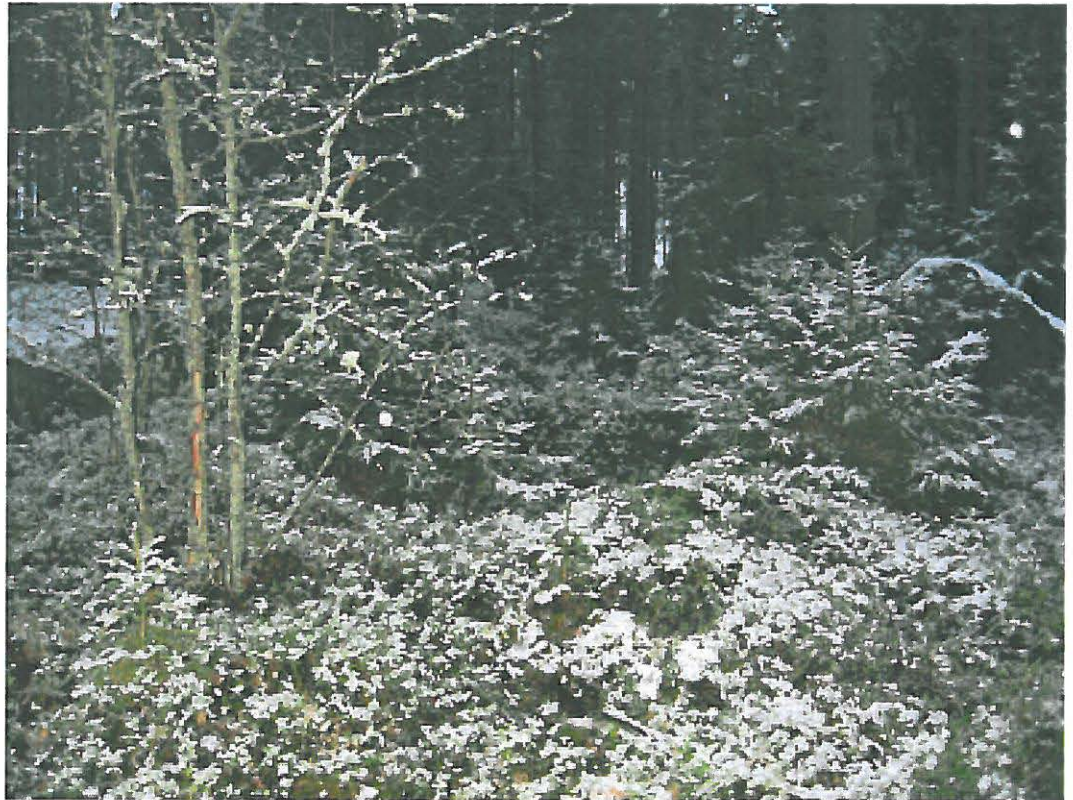
5. Uusikaupunki Savio. Luoteen puoleinen maakumpu d, jonka sisällä kuoppa. Kuvattu luoteesta. DT2009:32:11:kuva 029