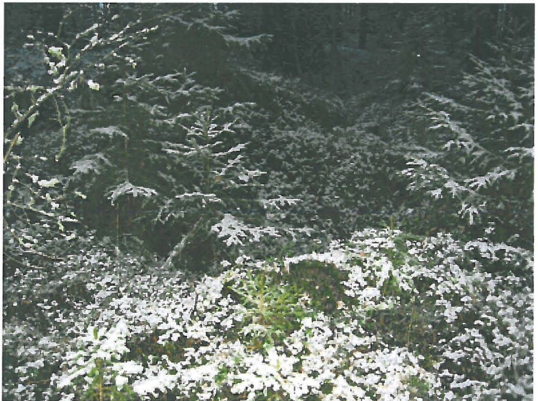
6. Uusikaupunki Savio. Luoteen puoleisen maakummun d sisään kaivettu kuoppa. Kuvattu luoteesta. DT2009:32:11:kuva 030