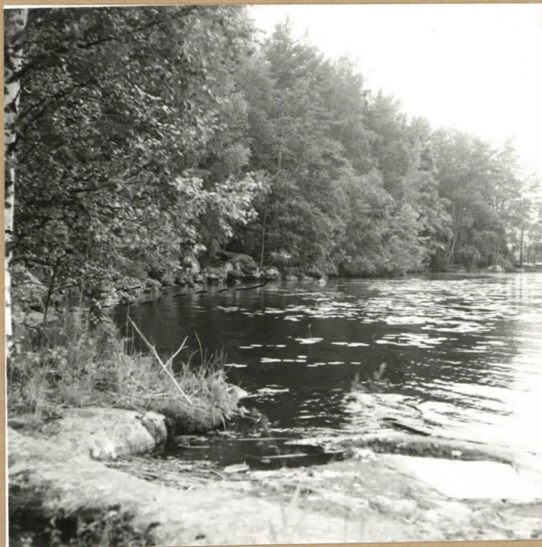
neg. 75954 Selkäsaaren kaullisranta, josta tunnetaan kivilautil. as. peukkaan 'mittaavia merkkejä'. Nykyisin veden alla. E