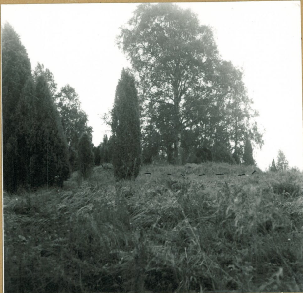
neg. 75952 Kalvaston keskellä, sen korkeimmalla kohdalla on suuri kiven- ja maansekainen rökkiö. NW.