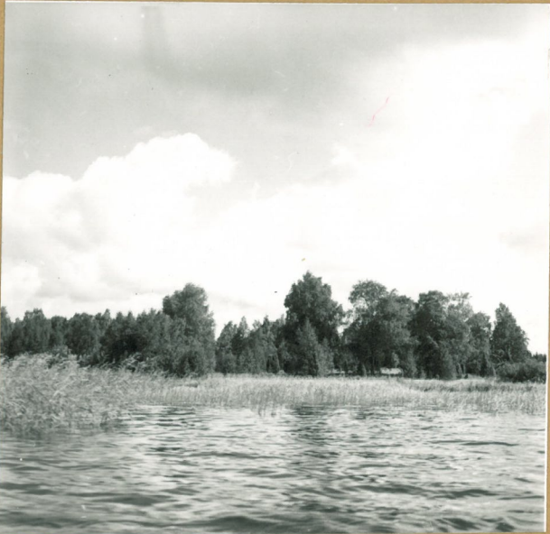
neg. 75950 Liekosaaressä kalvasto. Kuvattu Liekovedeltä. SW.