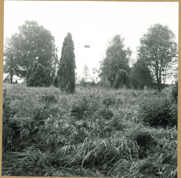
neg. 75951 Kalvaston rökkiöt ovat rehevän puustatuillisuuden peitossa. NNE.