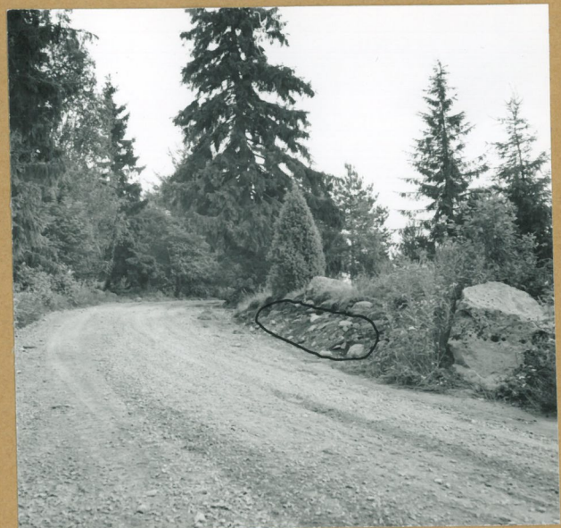
Neg. 67726 Kalmistoalueen pohjaosasta olevasta röykkiöstä oli koko sen pituudelta poistettu pintamaat.