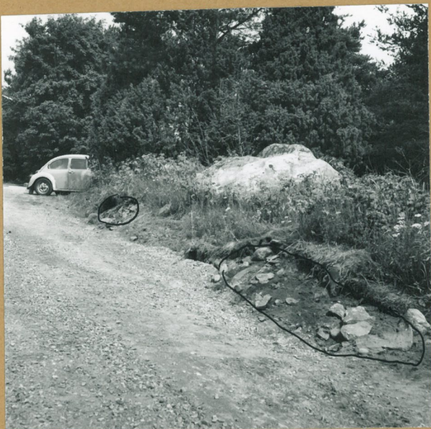
Neg. 67725 Kalmistoalueen etelä- osassa olevan röykkiön länsi- reunasta oli poistettu pinta- maata ja kiveystä kahdesta kohdasta.