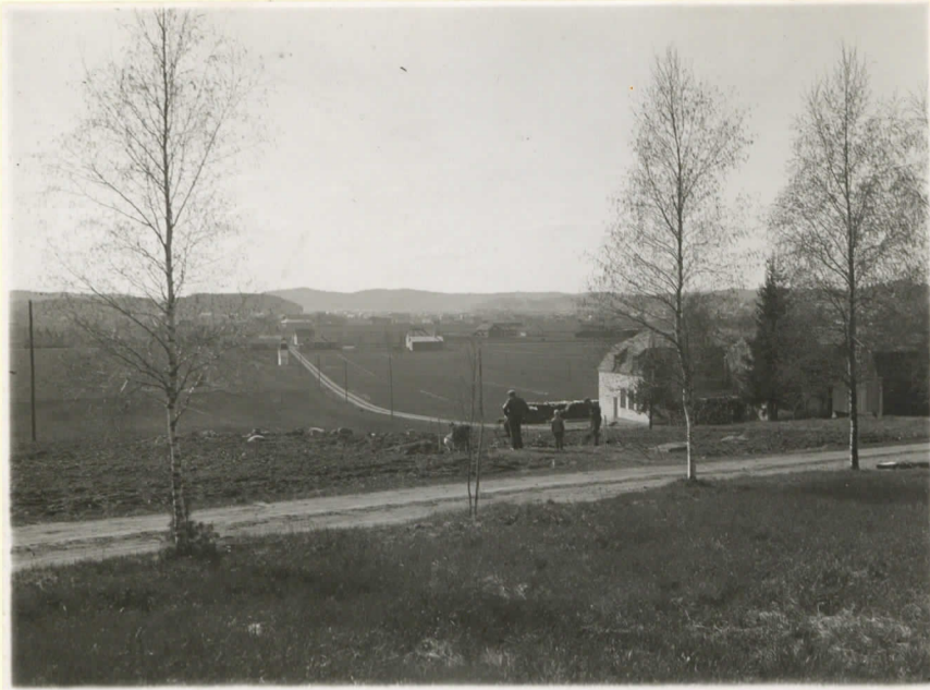
1. Kaivauspaikka valokuvattuna Vanuteh- taan autotallin luota Saloon päin. Miehet kaivauspaikalla. Oikealla vanutehtaasta van- hempi rakennus.