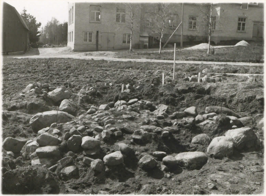
2. Röykkiö paljastettuna. Valokuva O:sta päin. Taustalla vanutehtaasta uudempi rakennus.