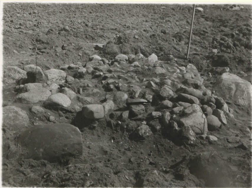
3. Röykkiö paljastettuna. Valokuva W:stä päin.