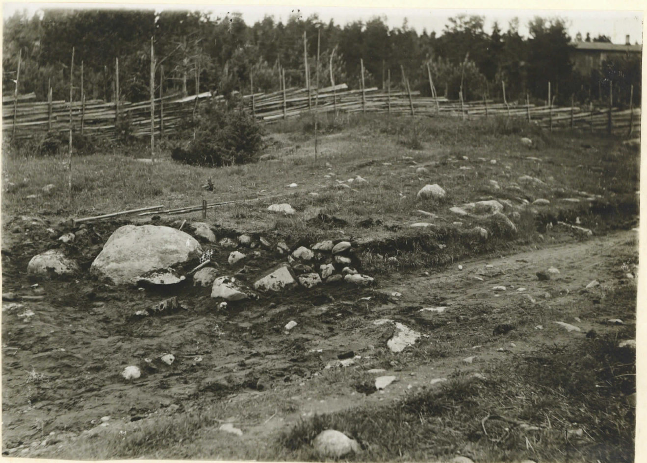
3. Fyndstället (x) på Perälä. I fonden till vänster Katajamäki.