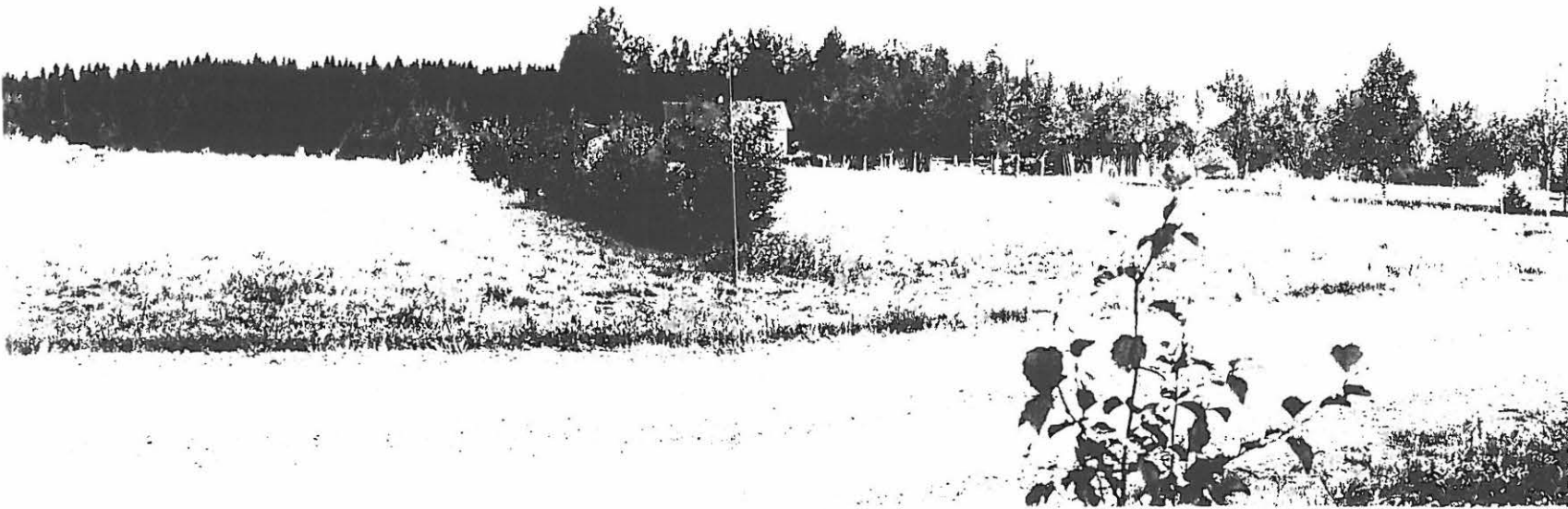
KUVA 1 : SIIKAMÄEN TALO KUVATTUNA PÖHJOISESTÄ. ATRONJOKI ON RAKENNUS- TEN TAKANA, VIRTAA VASEMMALTA OIKEALLE. KUVASSA VASEMMALLA NÄ- KYVÄN PELLON KUMPAREEL- TA, KASVIMAASTA, LÖYTYI KVARTSI-ISKOKSIA JA HIOTTU KIVI (KUM).