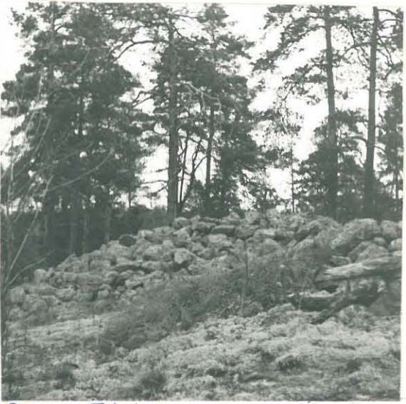
Pieni Talv'apaa, pronssikautinen haidenkiväs!