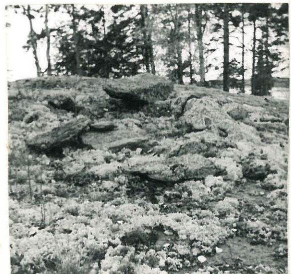
Joo Jalv'apaa. Livan muotoinen latomus (Kosken tutkinnut 1949).