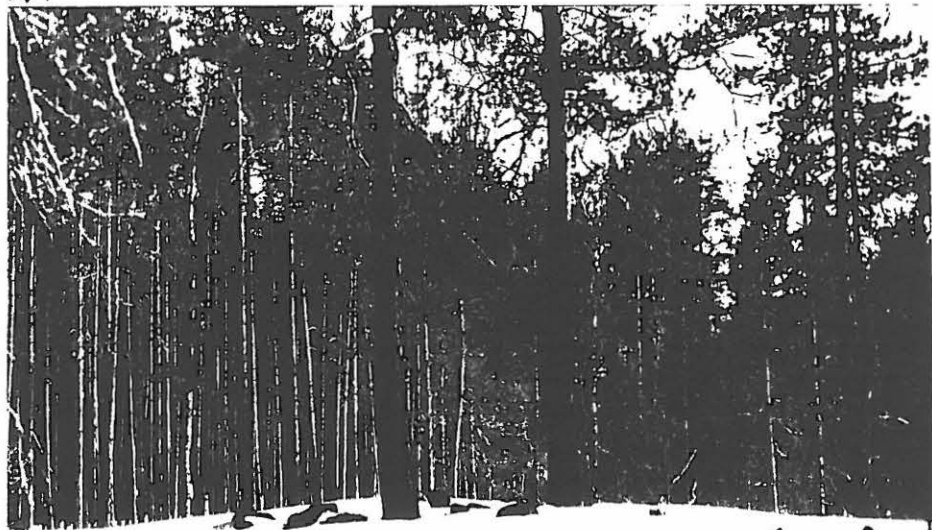
KUVA 2: KUVATTUNA KOHTI ETELÄKAAKKOA, VALOK. JOUKO AROALHO, 4.4.1998, 6x4,5.