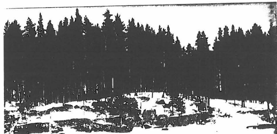
KUVA 3: RANTAKALLIO NÄH- TYNÄ LÄNNESTÄ PÄIN. KI- VET OVAT KORKEIMMALLA KOHALLA. 4.4.1998, 6x4,5