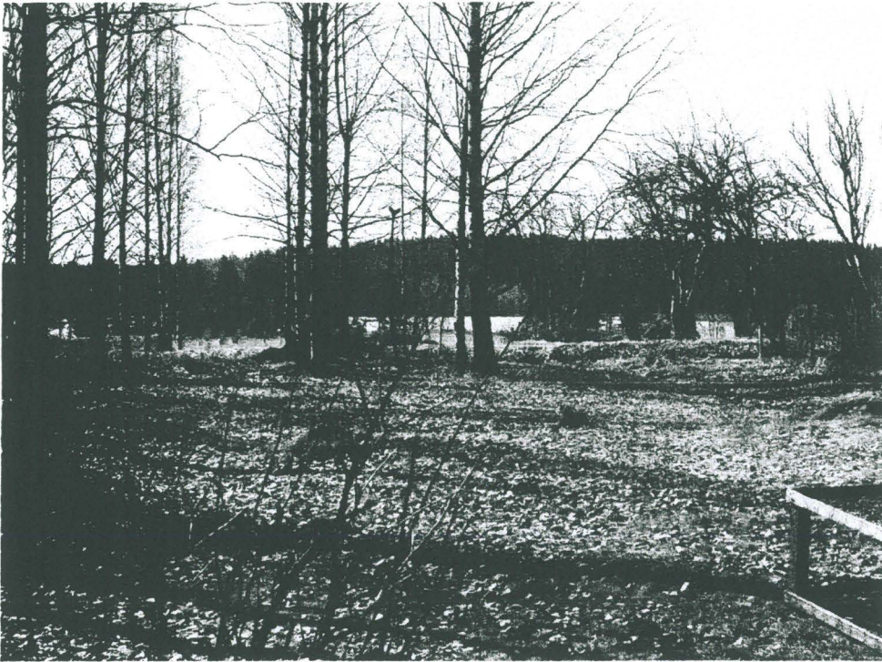
Vesilahti, Karholannokka. Suunnitellun vesijohtolinjan aluetta, kuvattu Kivirannan tilan asuinrakennuksen edustalta etelään.