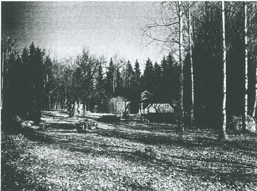
Vesilahti, Karholannokka. Etelästä kuvattu kohti Kivirannan asuinrakennusta tulevan vesijohtokaivannon aluetta. Kuvassa näkyvällä alueella ei sijaitse röykkiöitä.