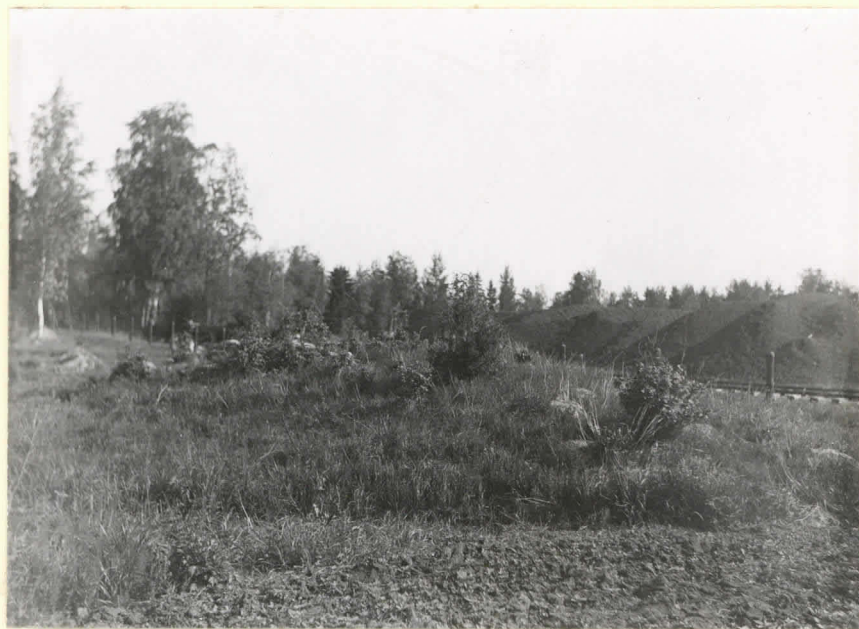
Hautauskunnan eteen tuthinuksia. L.13414.