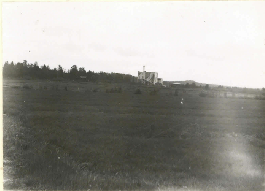
Voimalaitos lounaasta otokuvattuna. L.13412.