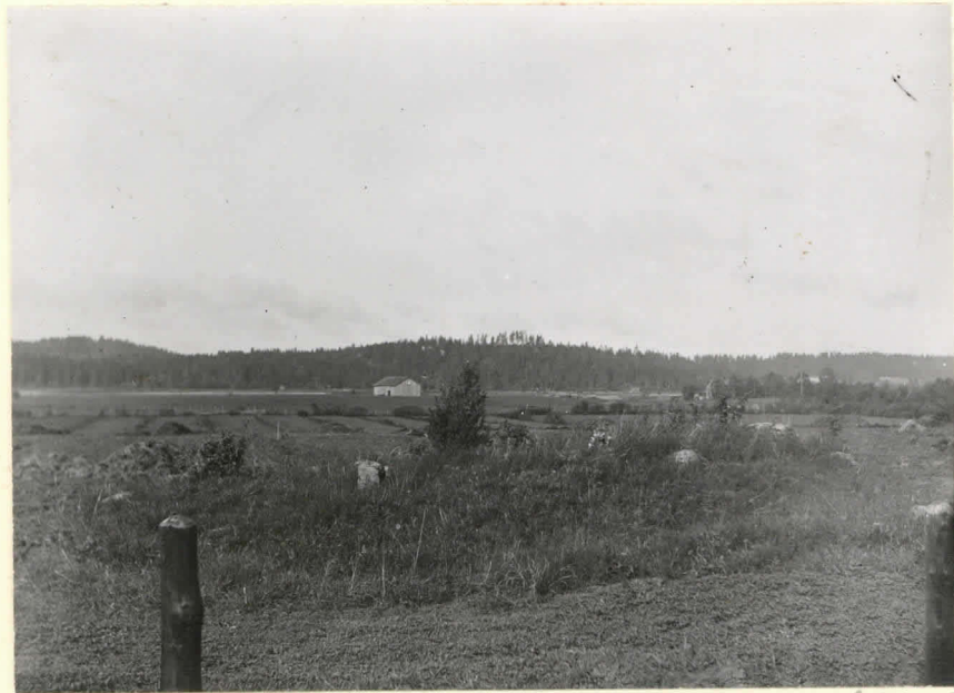
Hautauskunnan etualalla, valokuva - vattu källisestä käsin. L.13413.