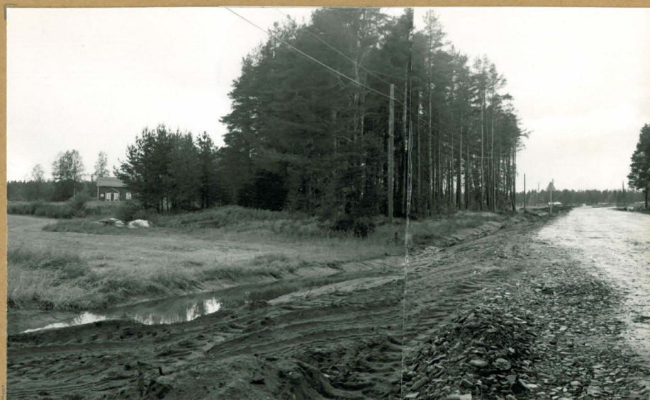
Taustalla kourutaltan (KM 11660) löytöpaikka, SE:sta.